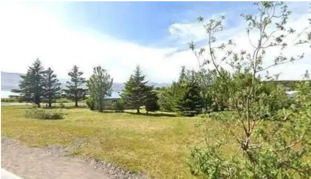
Posthus breiddalsvik street view 360deg