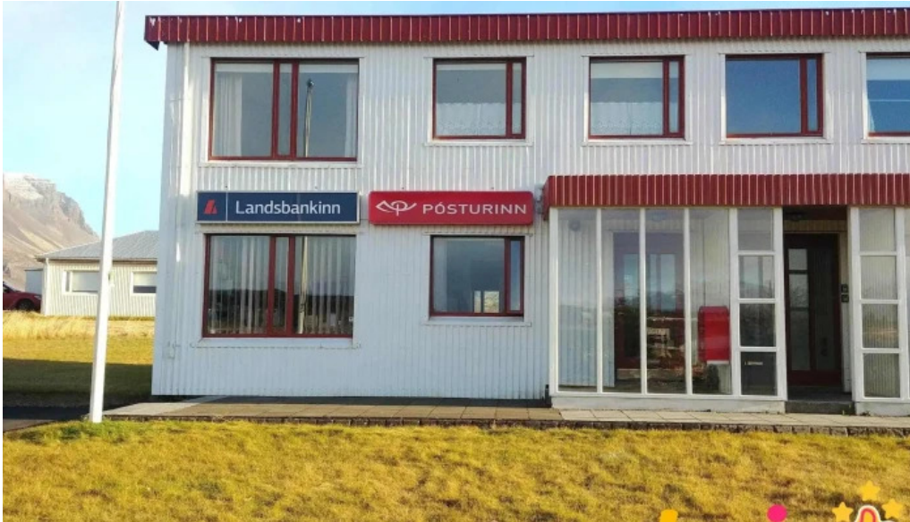
Posthus breiddalsvik posthus