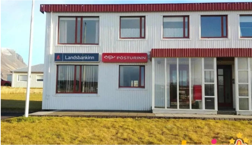
Posthus breiðdalsvik breiðdalsvik