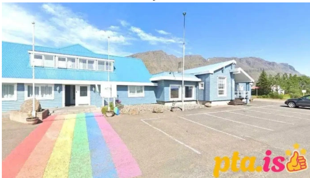
Postbox breiðdalsvik breiðdalsvik