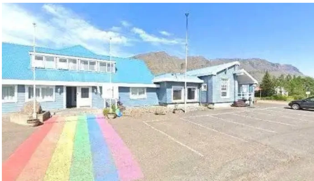
Postbox breiddalsvik posthus