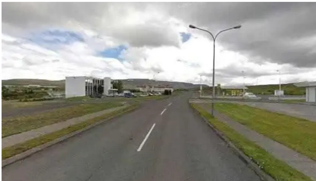
Islandspostur street view 360deg