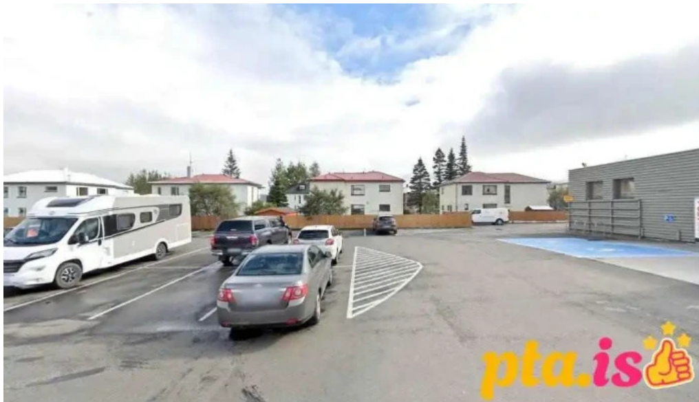
Postbox akureyri við hagkaup akureyri