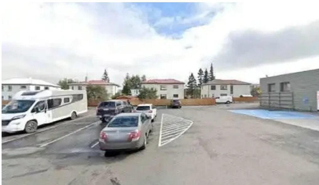
Postbox akureyri við hagkaup posthus