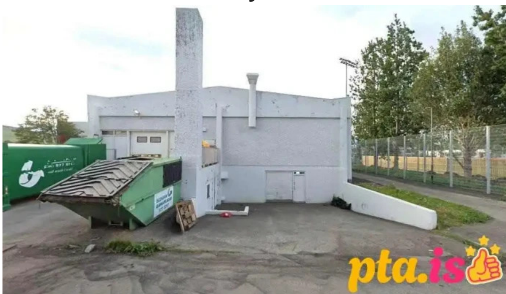
Postbox akureyri hrisalundi við netto akureyri