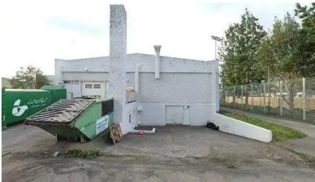
Postbox akureyri hrisalundi vid netto posthus