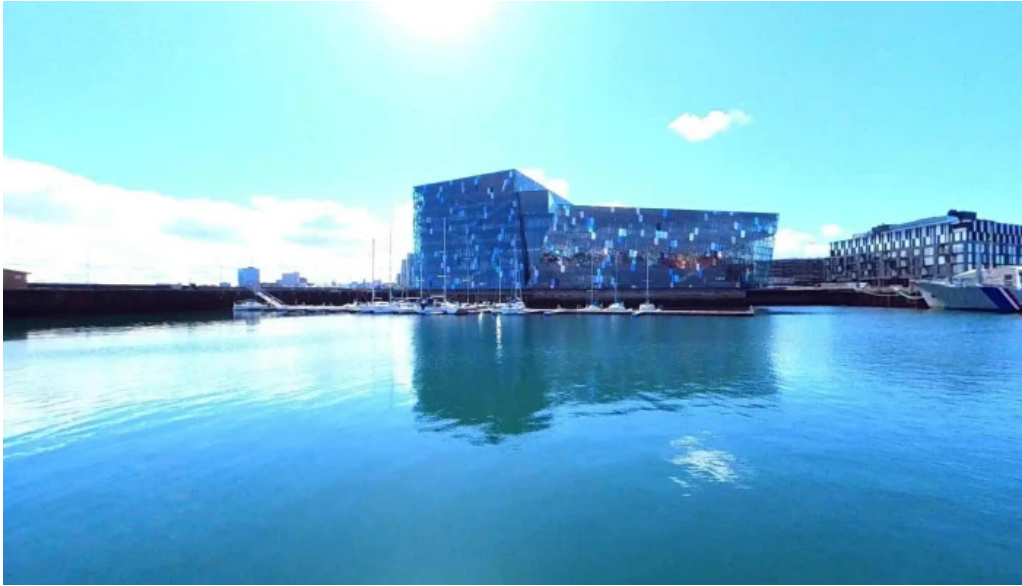
Reykjavíkurbær street view 360