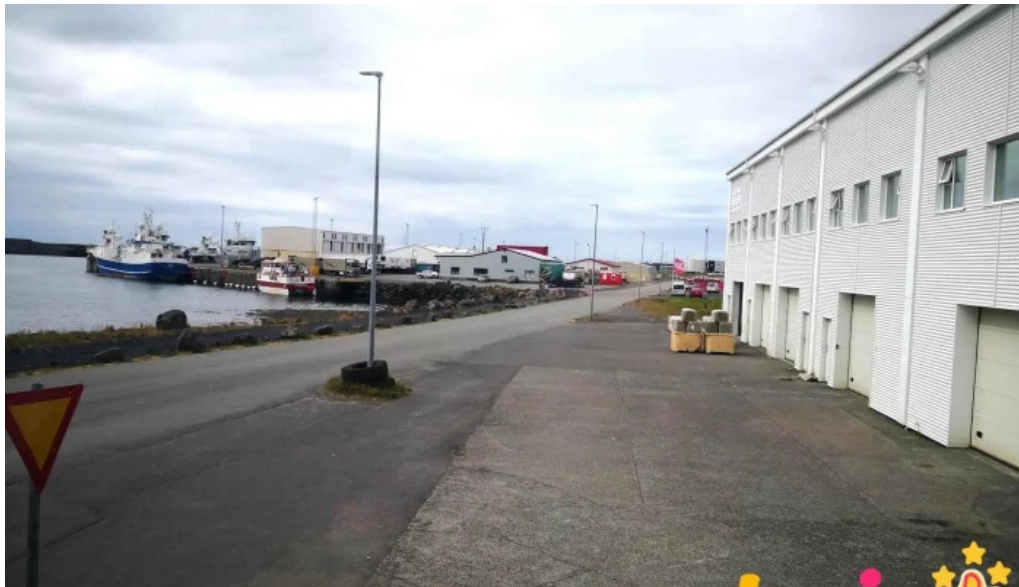
Port de grindavik batur