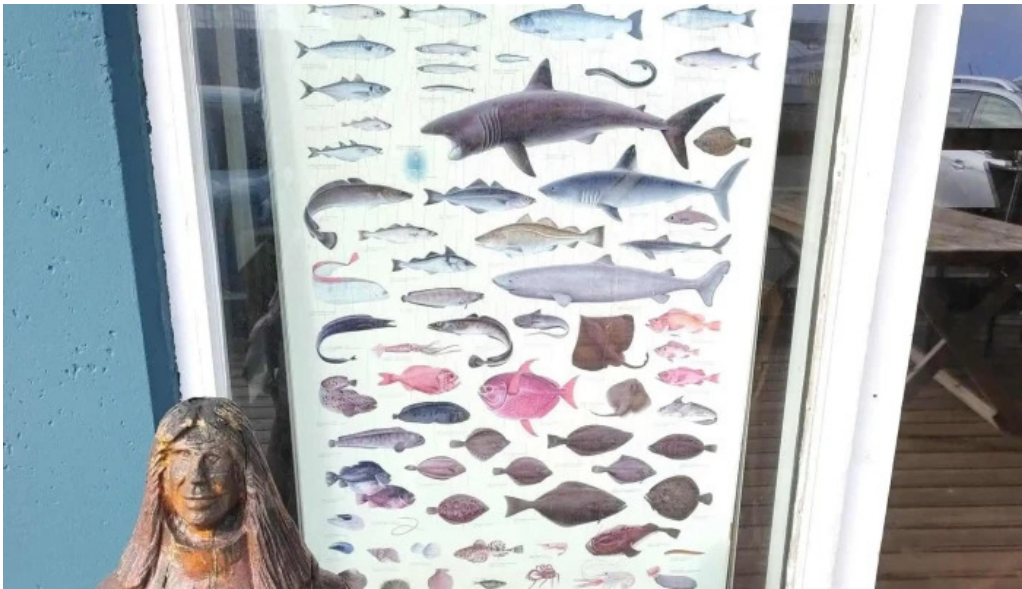
Port de grindavik staðsetning