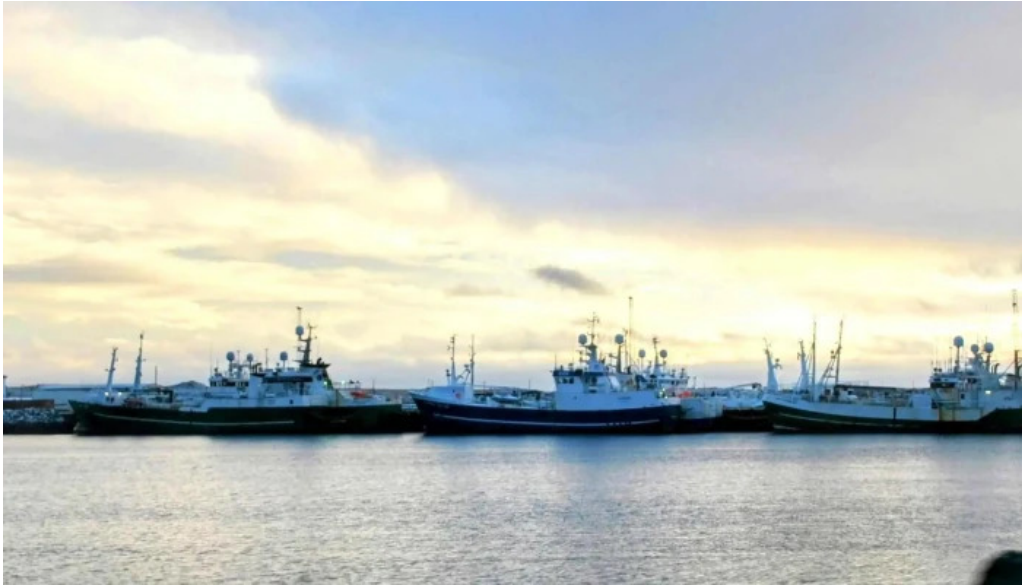
Port de grindavik kynning