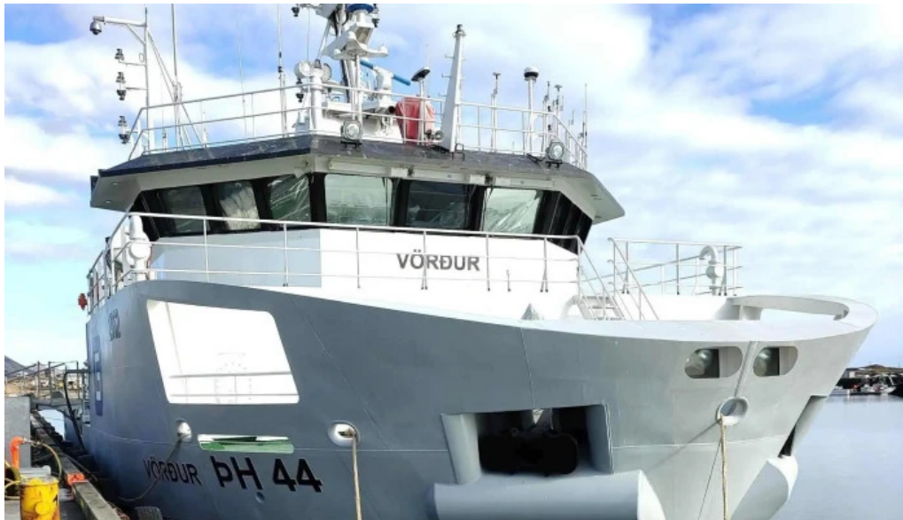
Port de grindavik athugasemdir