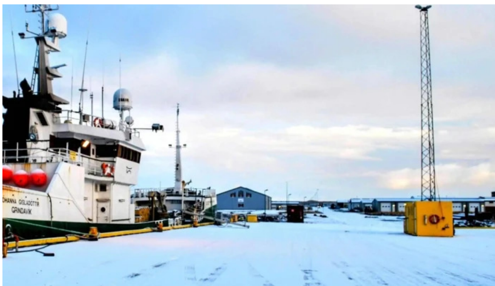
Port de grindavik umsagnir