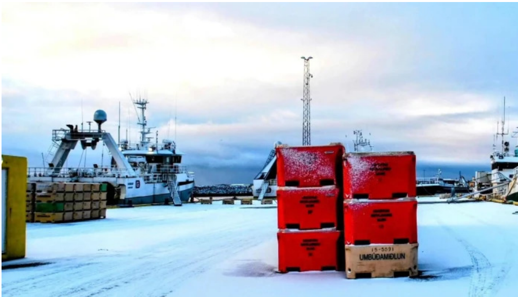
Port de grindavik hvernig a að komast þangað