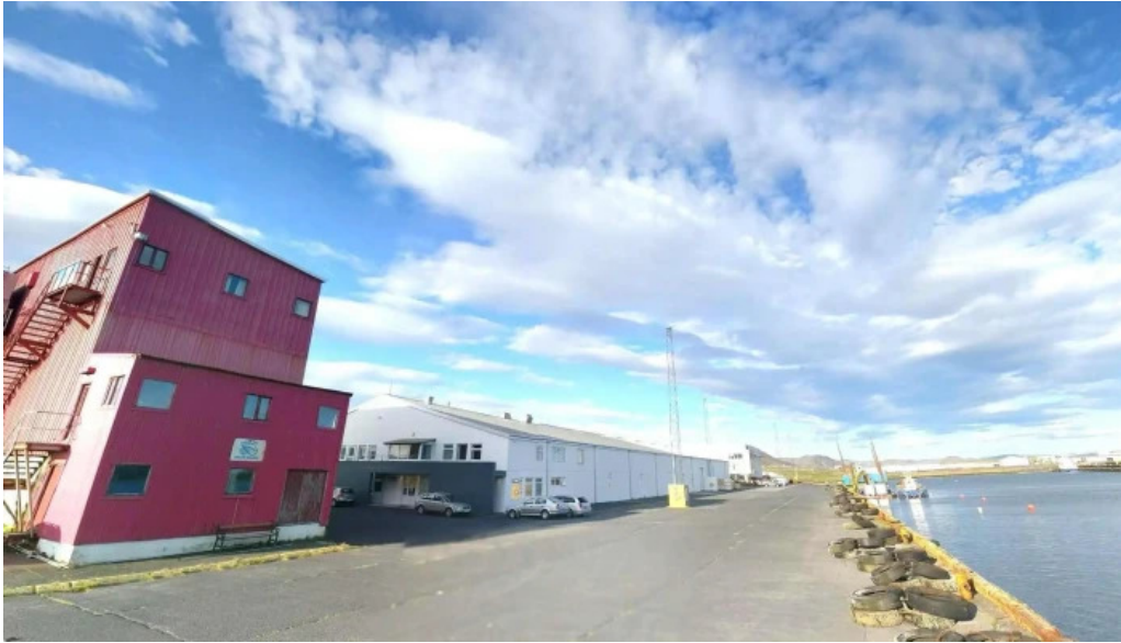
Port de grindavik street view 360deg