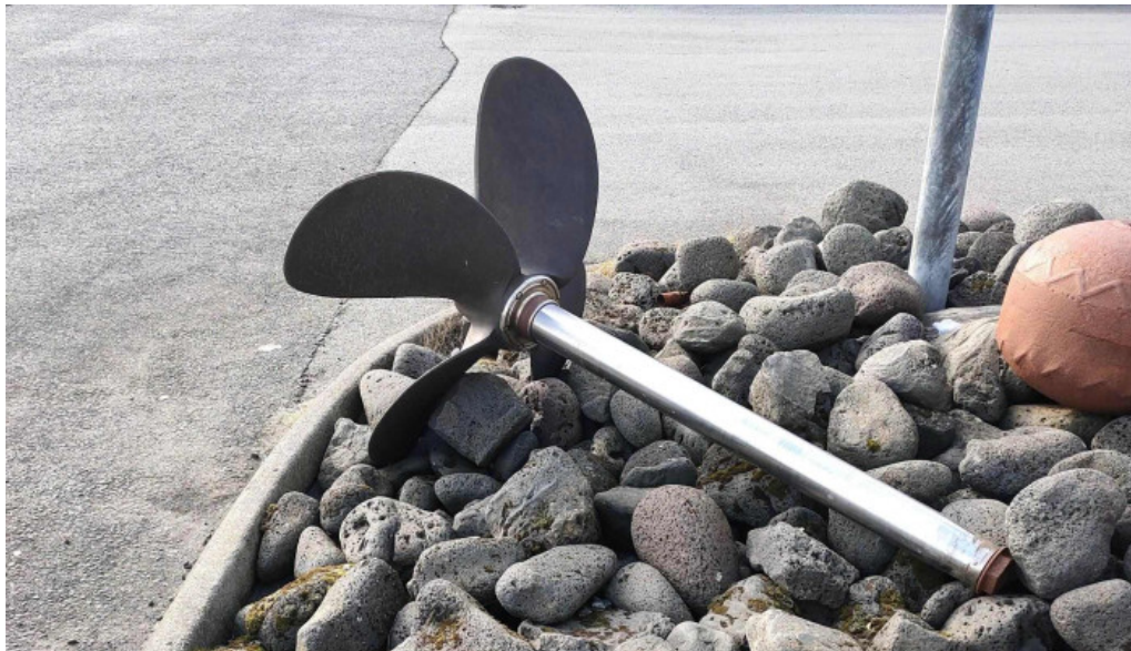
Port de grindavik afslættir