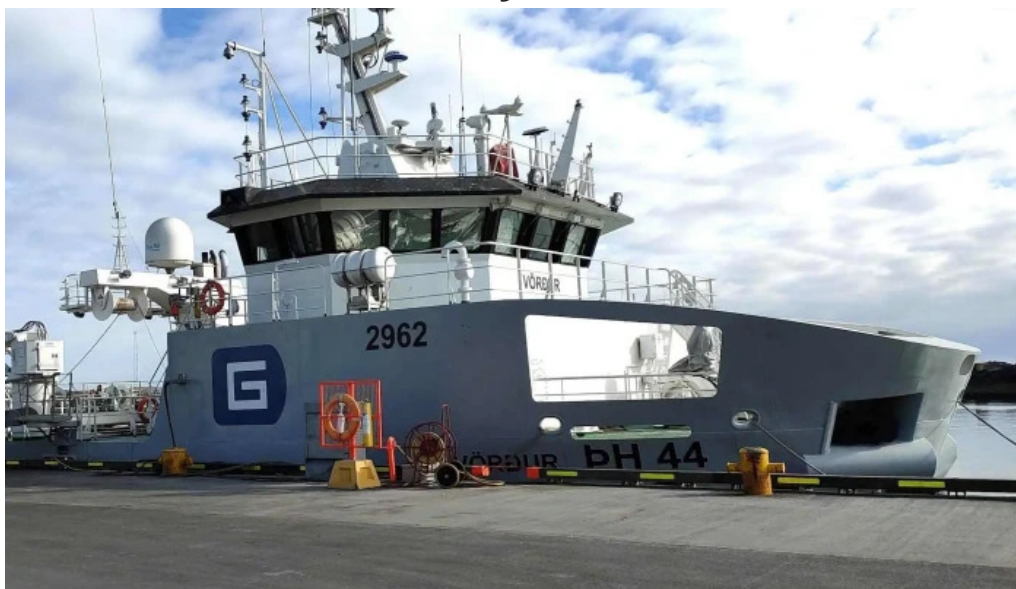
Port de grindavik vefsiða