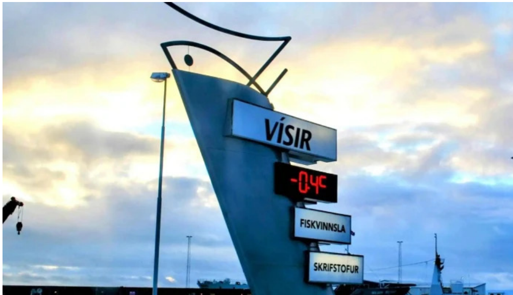
Port de grindavik grindavik