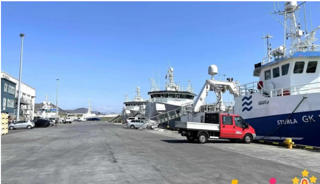
Port de grindavik port