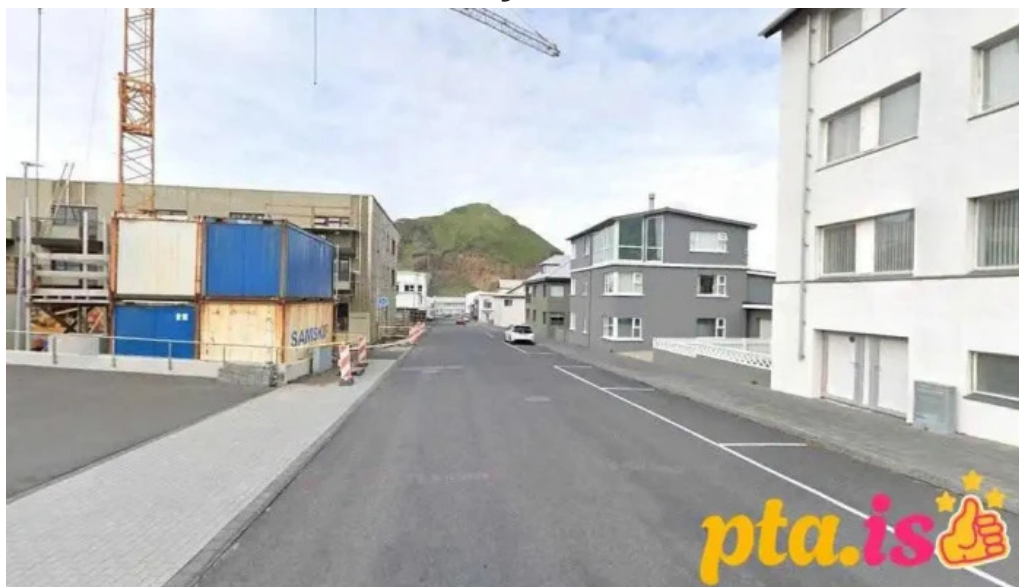
Sýslumaðurinn i vestmannaeyjum vestmannaeyjabær