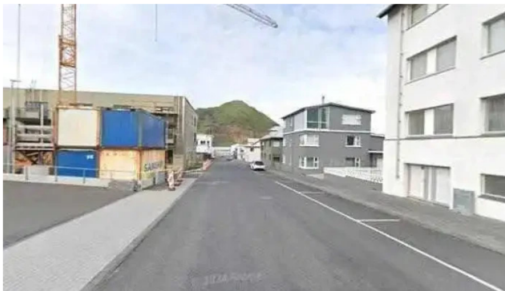
Sýslumadurinn i vestmannaeyjum opinber skrifstofa