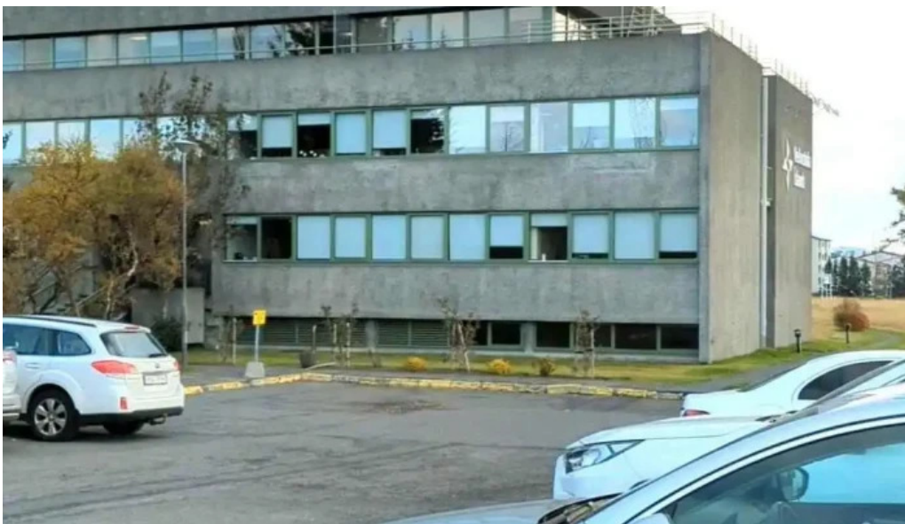
Vedurstofa islands myndскеid