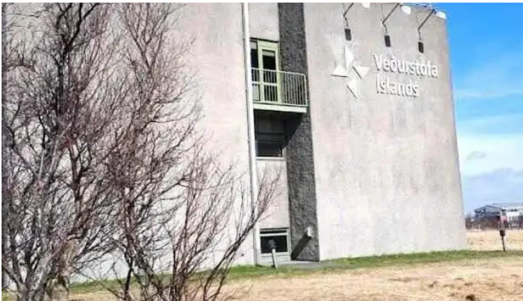
Veðurstofa Íslands Reykjavík