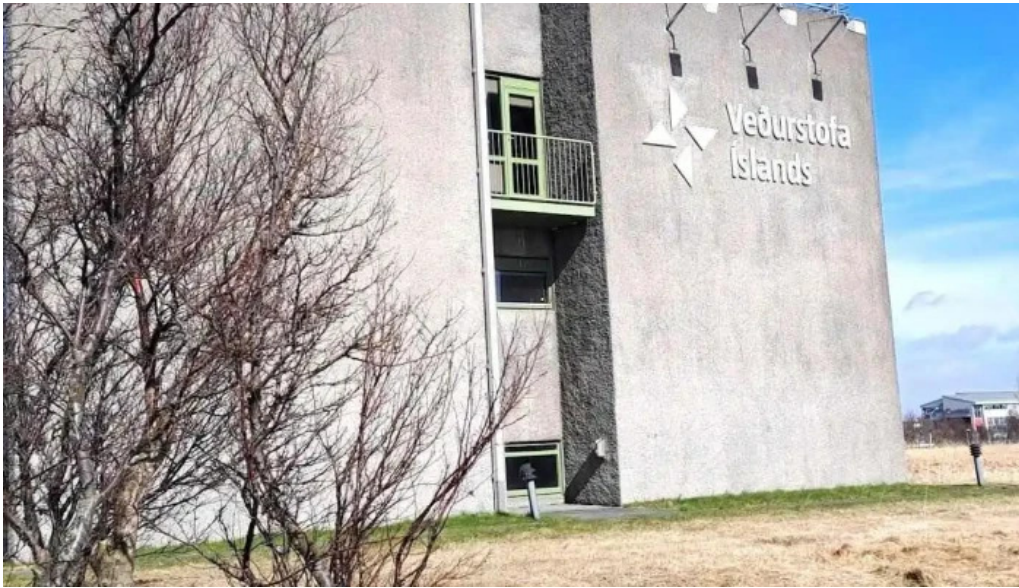
Vedurstofa islands opinber skrifstofa