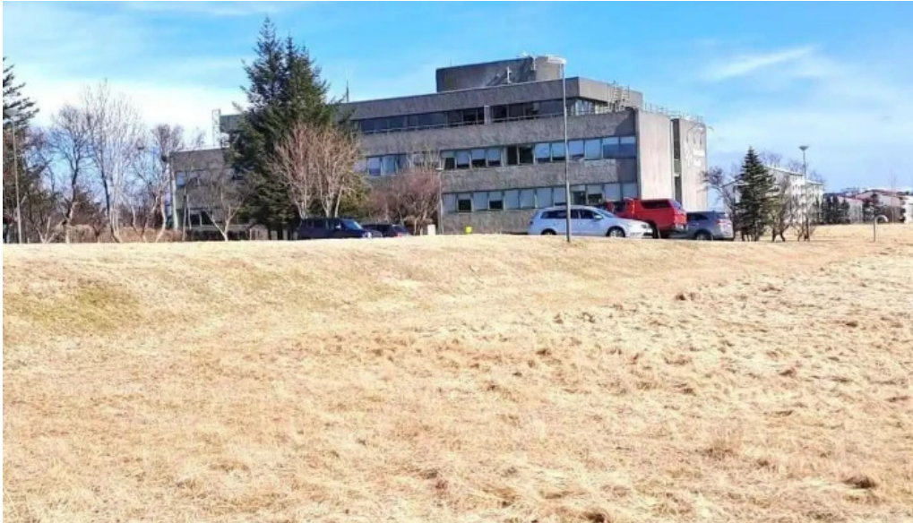
Vedurstofa Íslands bygging