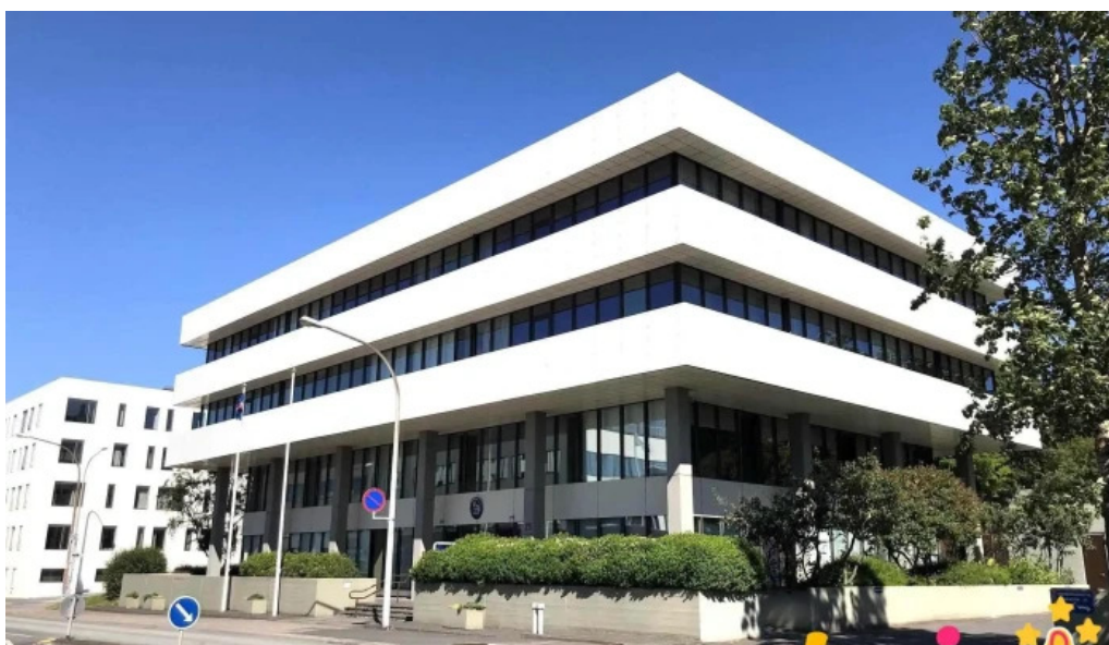
Utanríkisráðuneytið opinber skrifstofa