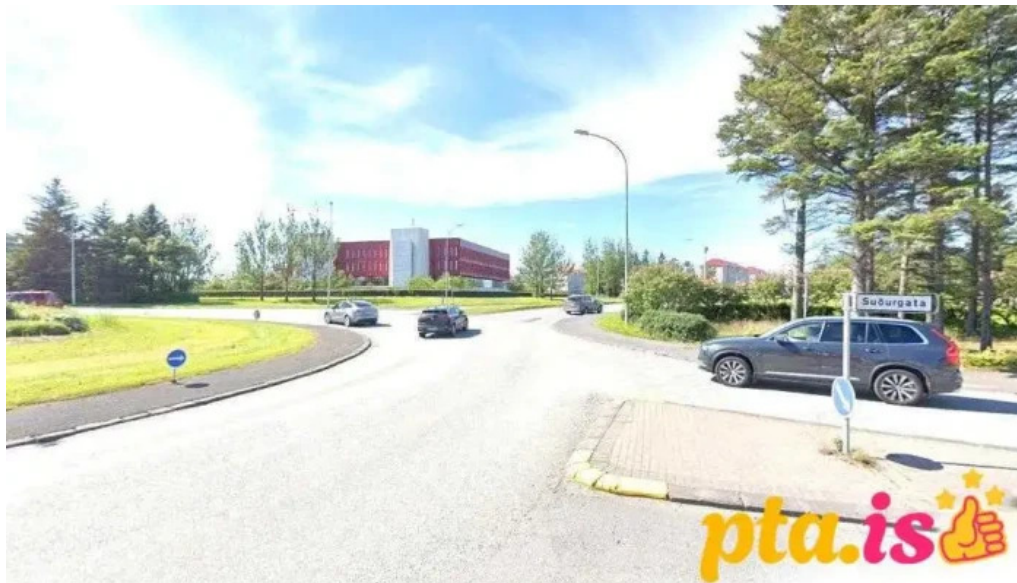
Minjastofnun islands reykjavik