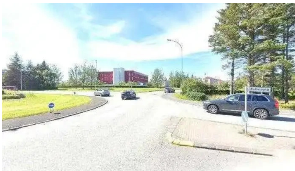
Minjastofnun islands opinber skrifstofa