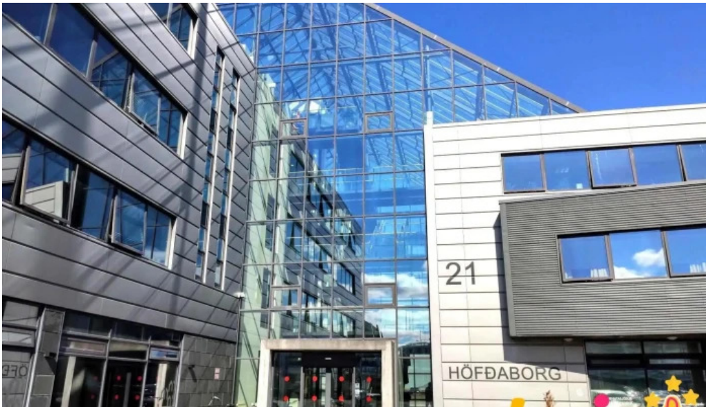
Lin lanasjodur islenskra namsmanna opinber skrifstofa