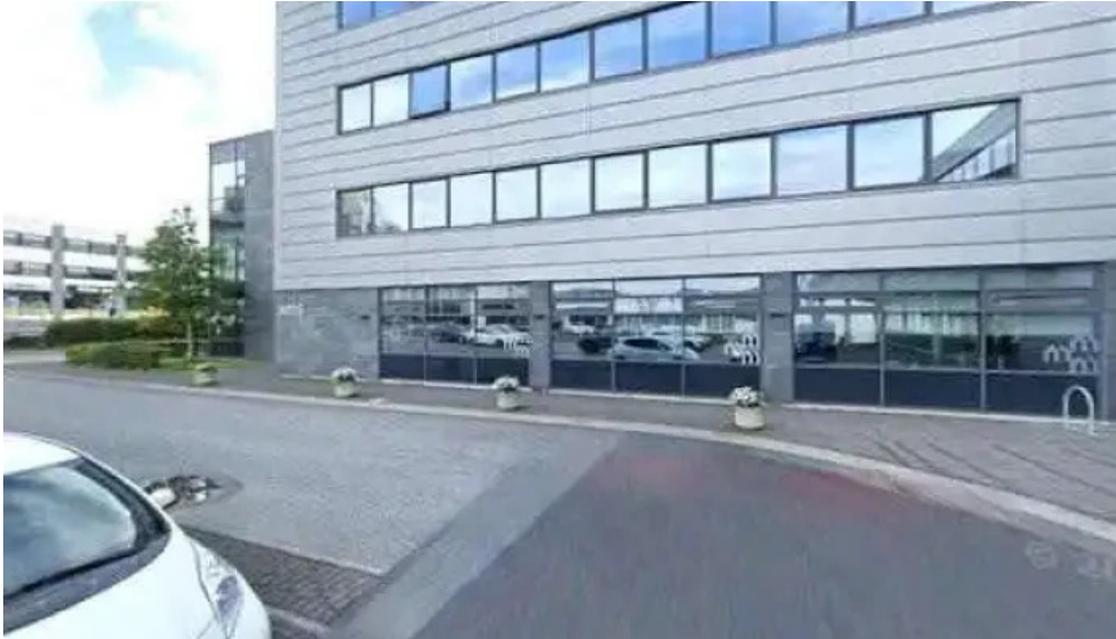
Lin lanasjodur islenskra namsmanna street view 360deg