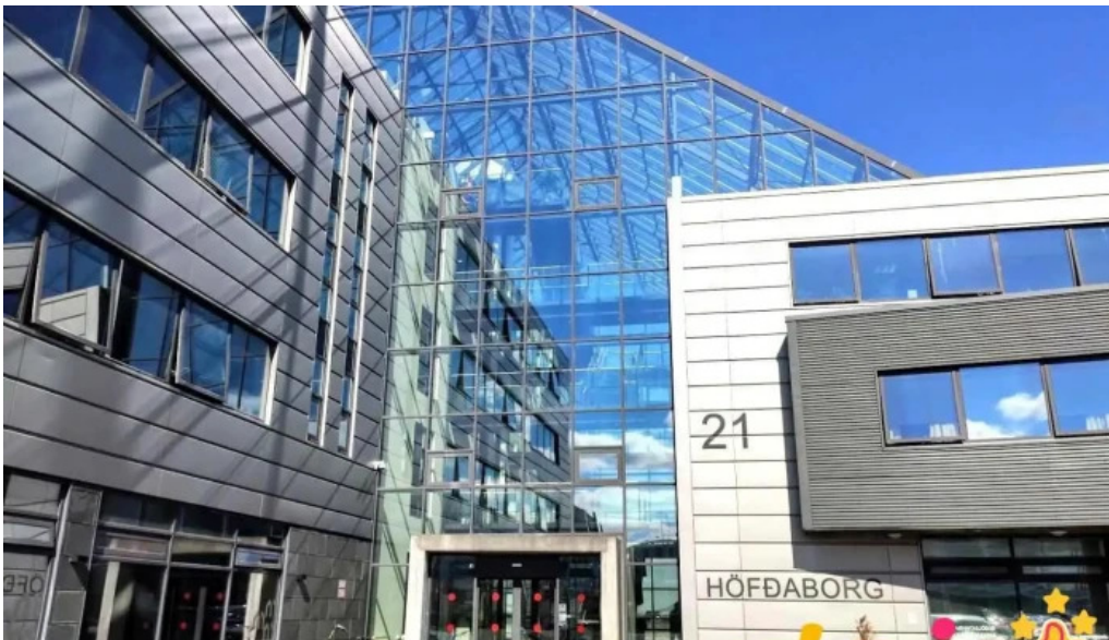
Lín lánasjóður íslenskra námsmanna reykjavík