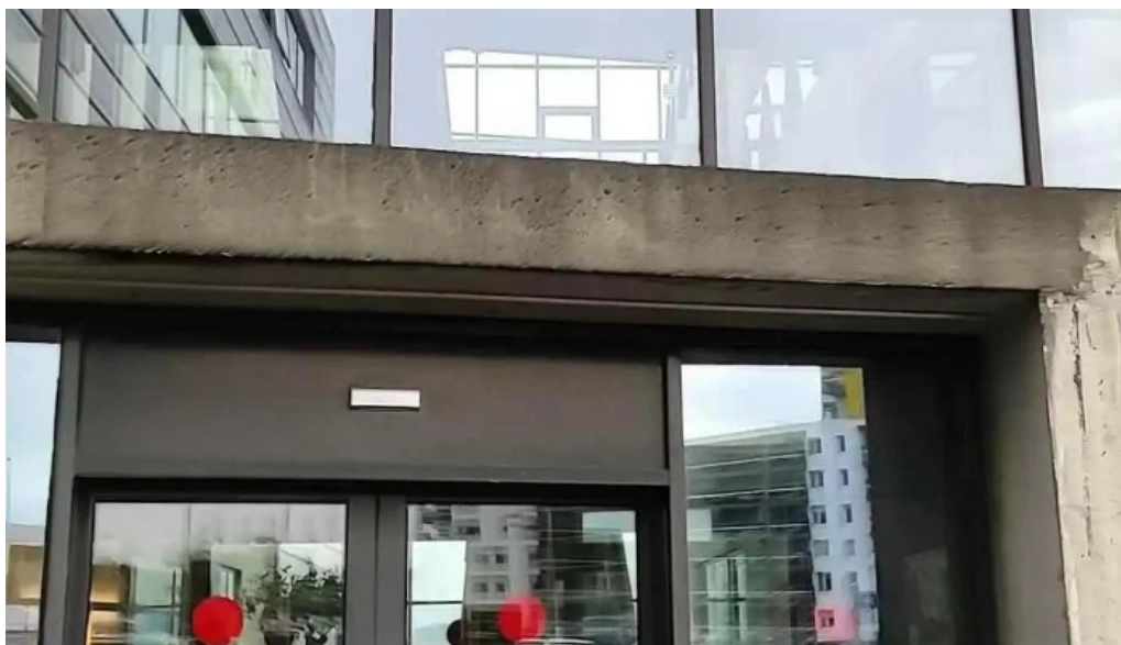
Lin lanasjodur islenskra namsmanna myndskaid