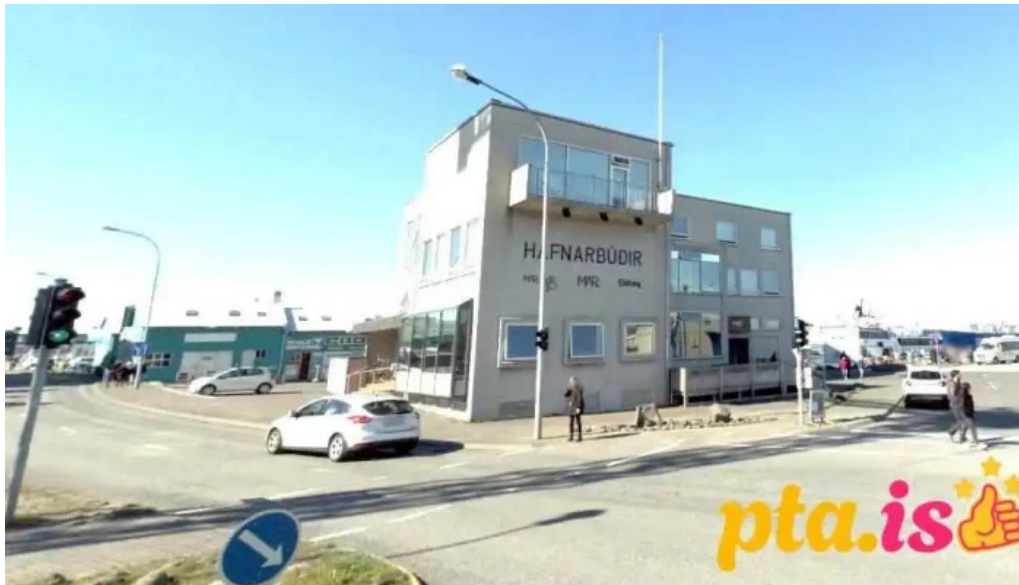
Ferdamalastofa opinber skrifstofa