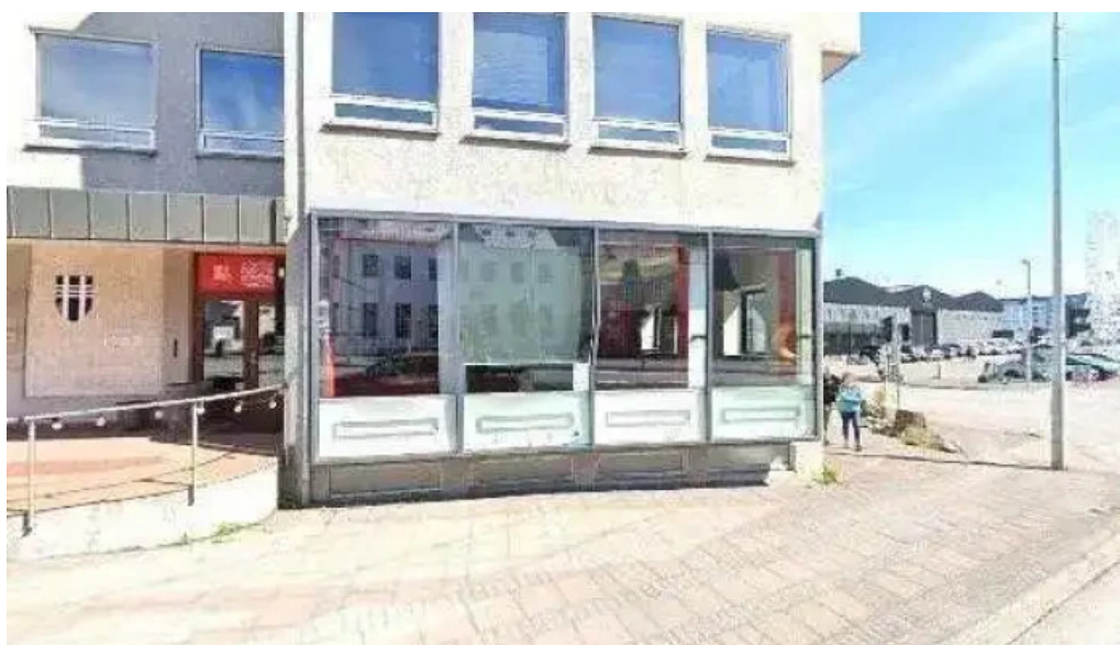
Ferðamalastofa street view 360