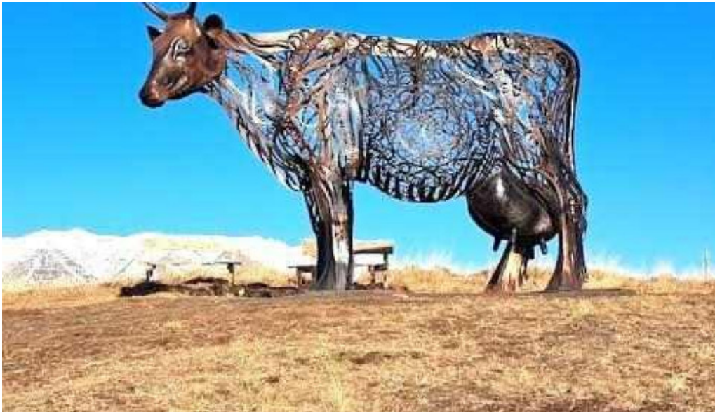
Eyjafjarðarsveit skrifstofa hrafnagilshverfi