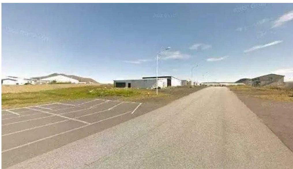
Áhaldahús þjónustumiðstöð opinber skrifstofa