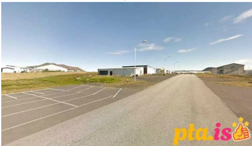
Áhaldahús ? þjónustumiðstöð grindavík