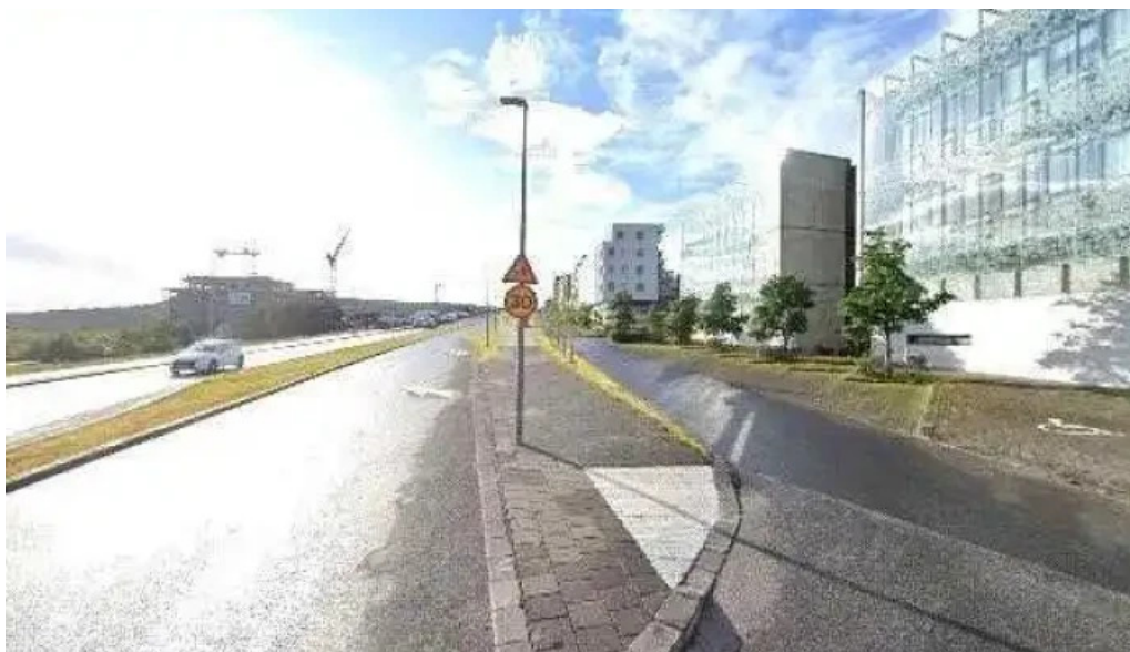
Natturfræðistofnun opinber skrifstofa