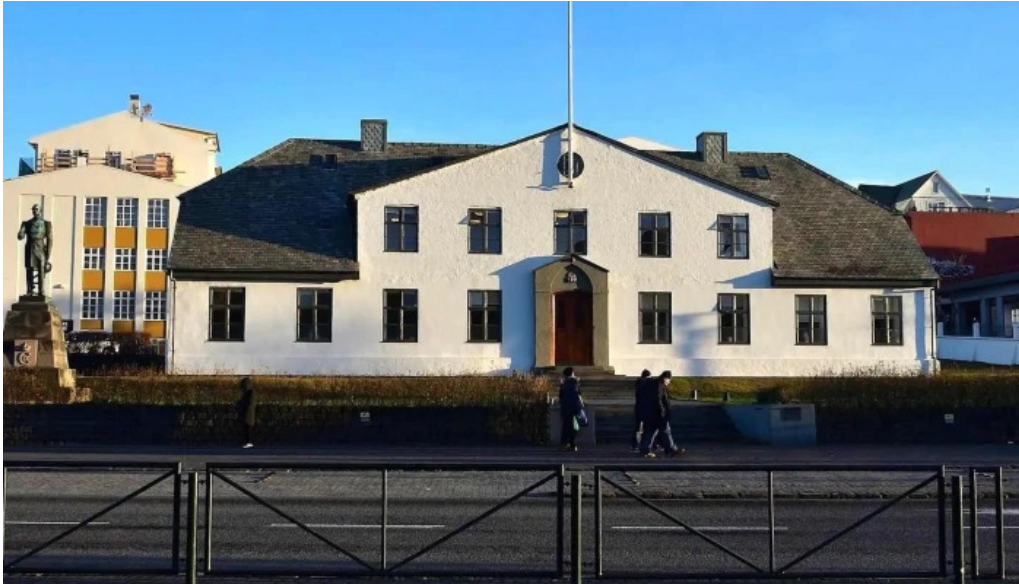
Forsætisraduneytid hvernig a að komast þangað