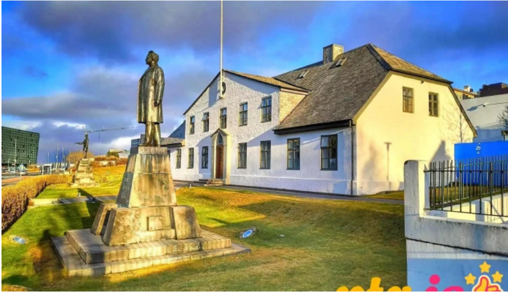
Forsætisraduneytid opinber rikisskrifstofa