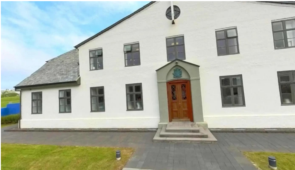
Forsaetisraduneytid street view 360deg