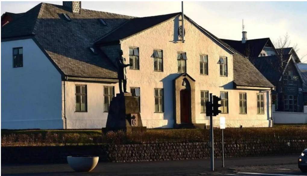
Forsaetisraduneytid opið nuna