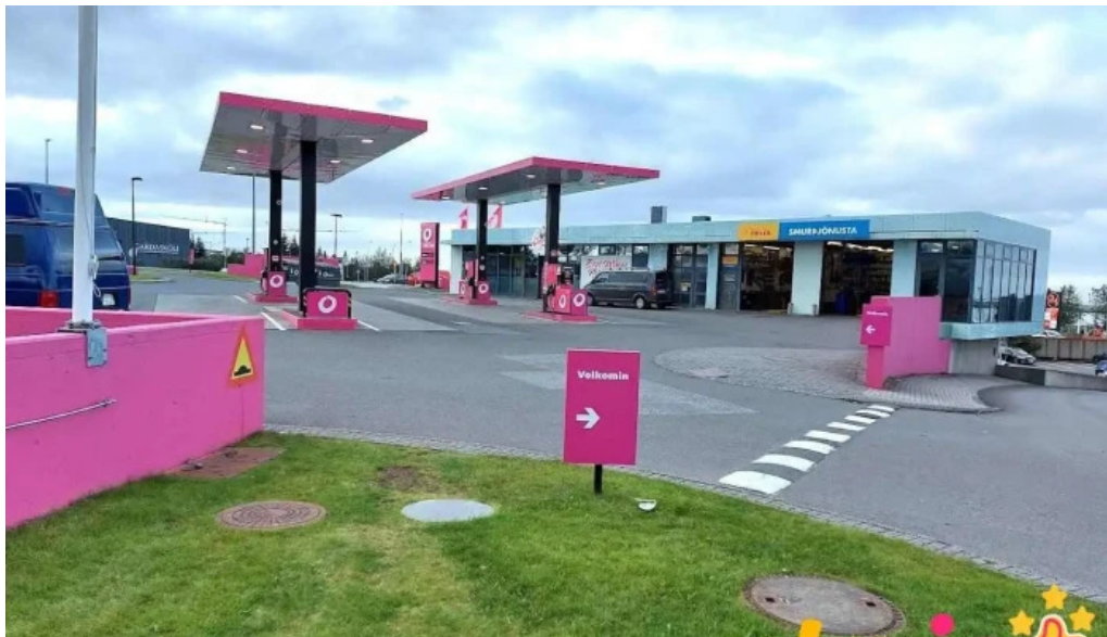
Smurstoðin garðabæ garðabær