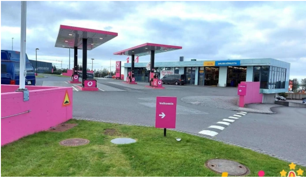
Smurstodin gardabae oliuskiptistöð