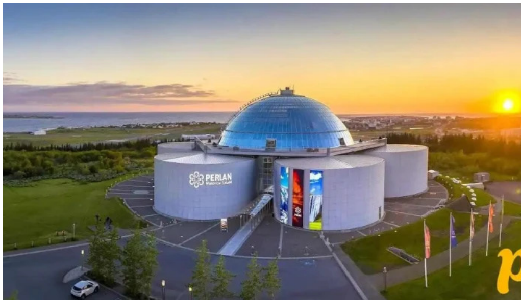
Perlan fra eiganda