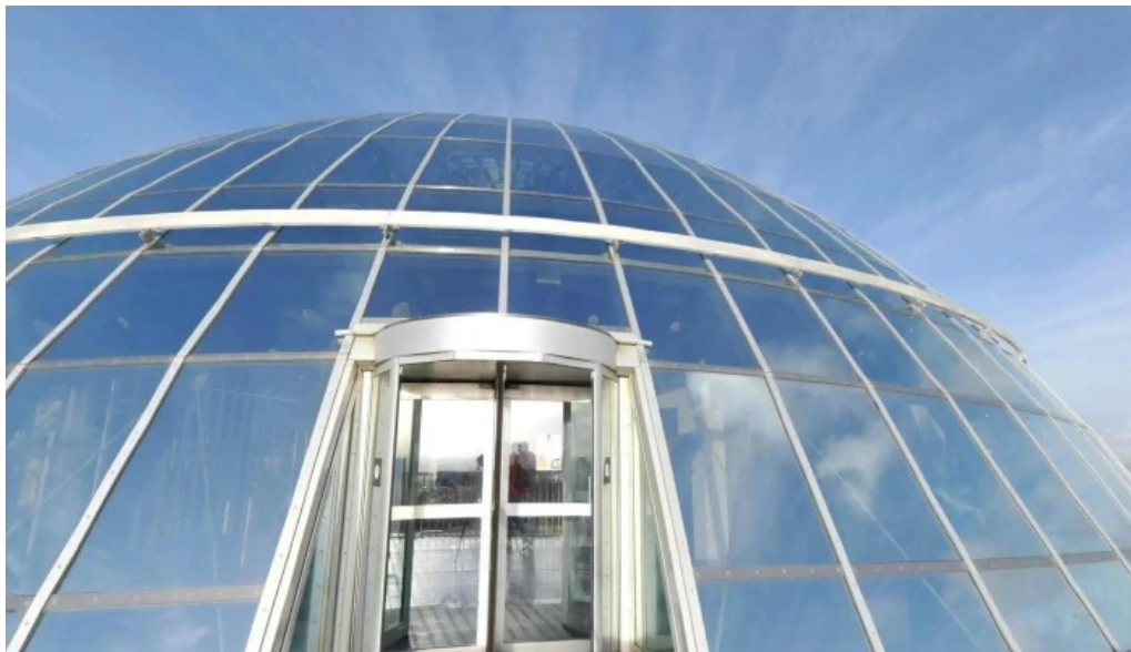
Perlan street view 360