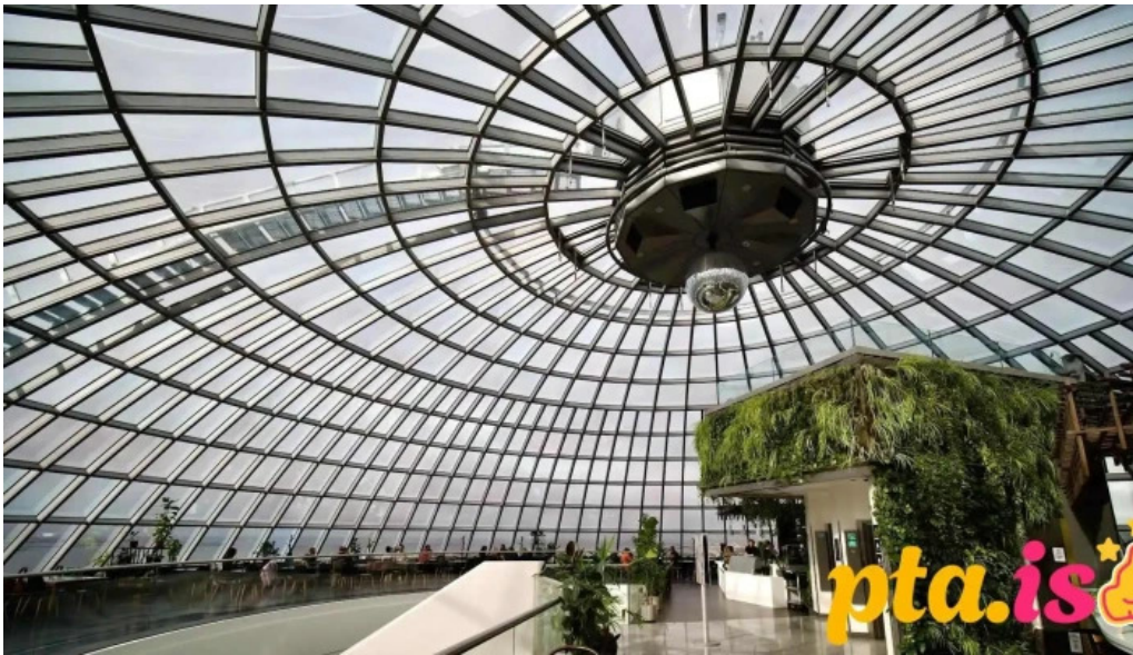
Perlan restaurant cafe