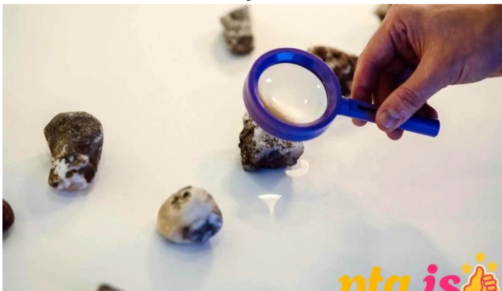
Natturufraedistofa kopavogs kopavogur