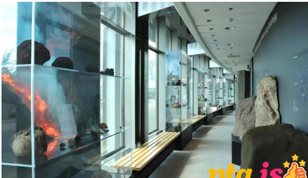
Naturufraedistofa kopavogs fra eiganda