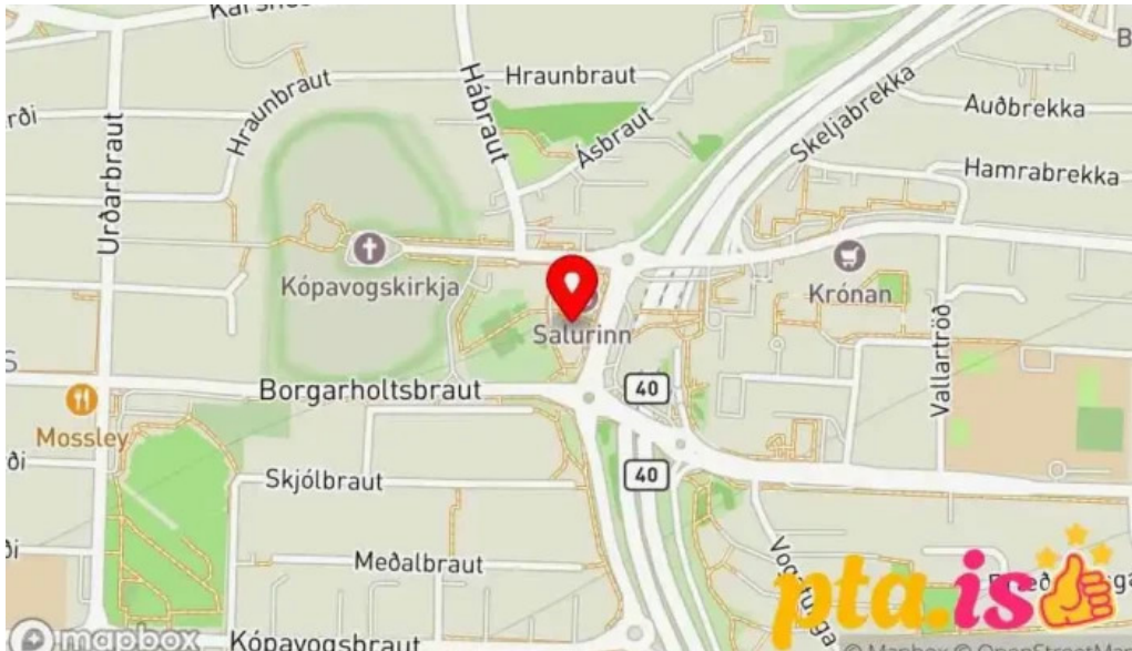
Naturufraedistofa kopavogs Kort