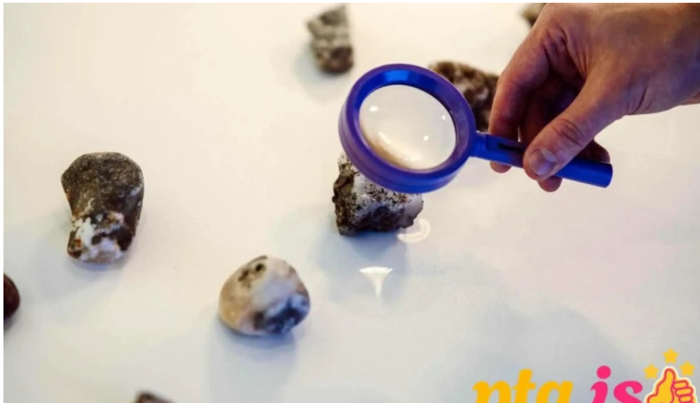
Naturufraedistofa kopavogs natturusogusafn