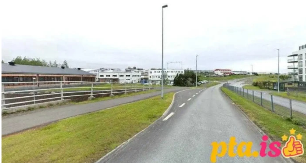
Alþjóðaskólinn á Íslandi garðabær