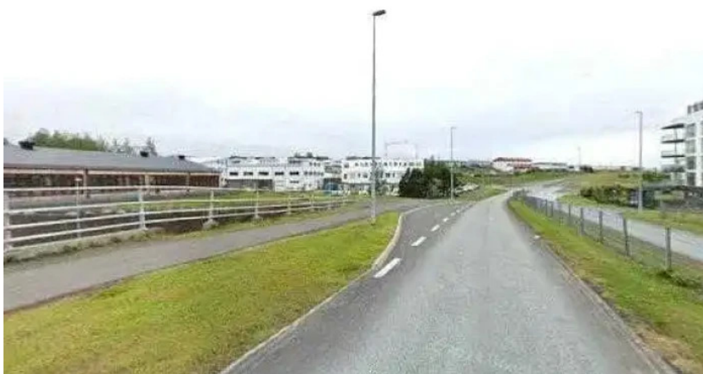
Alþjóðaskólinn á Íslandi miðstigsskóli