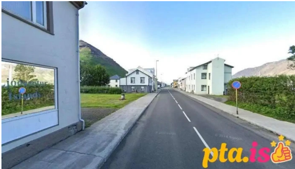
Ljóðasetur íslands siglufjörður