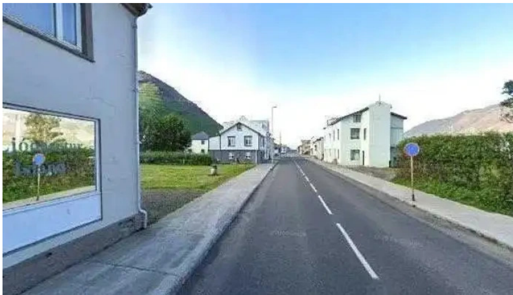
Ljóðasetur íslands menningarmiðstöð