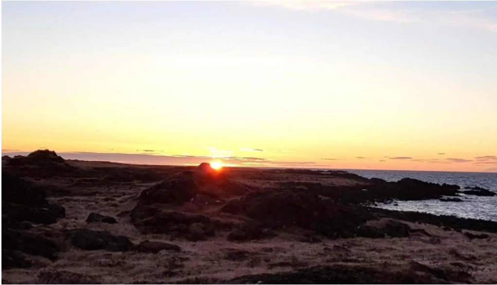
Iceland verslun einkunn