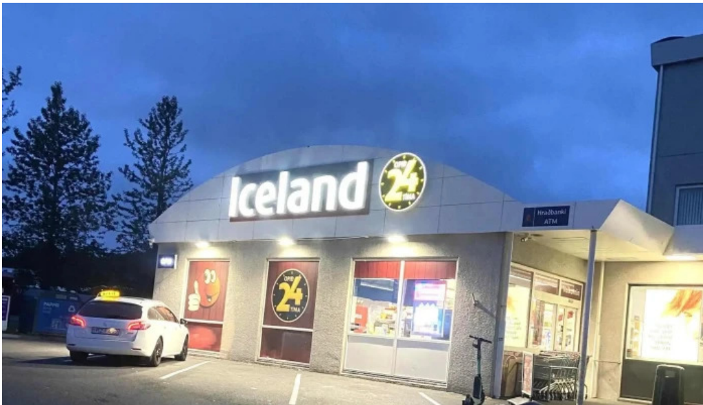
Iceland verslun hafnarfjorður