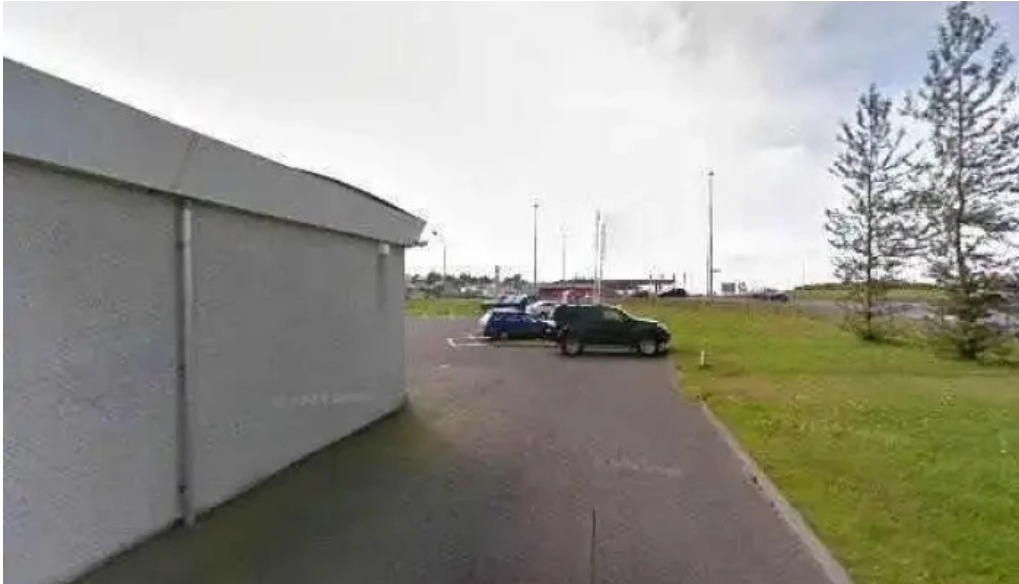
Iceland verslun street view 360deg