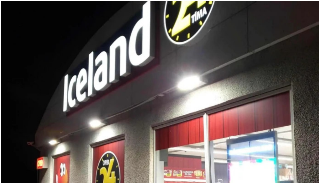
Iceland verslun staðsetning