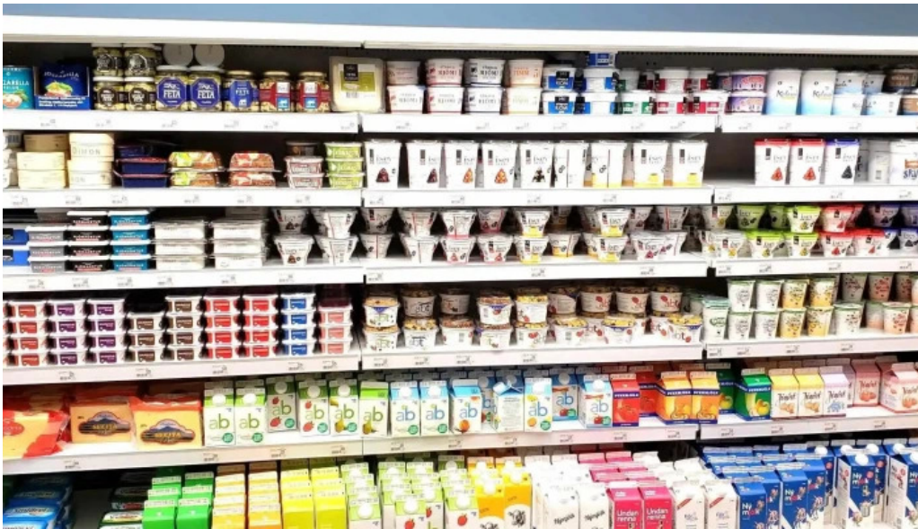
Iceland verslun afslættir