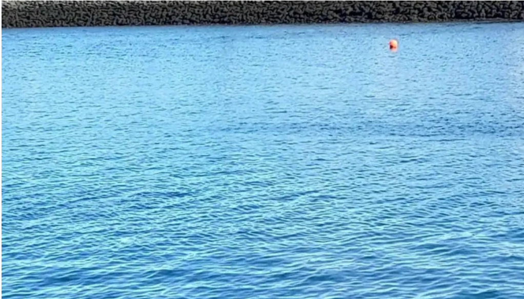
Iceland verslun matvoruverslun