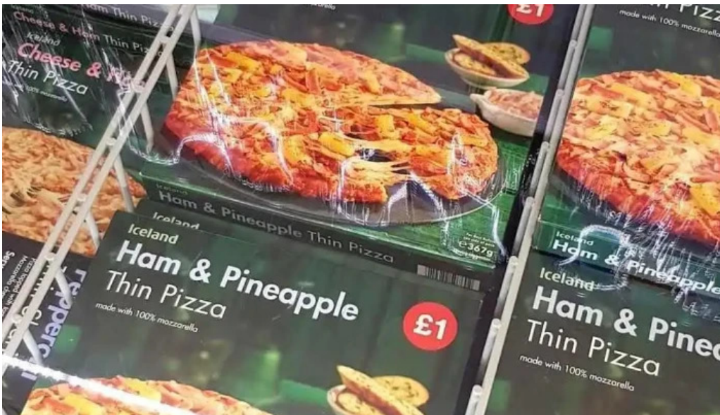
Iceland verslun matur