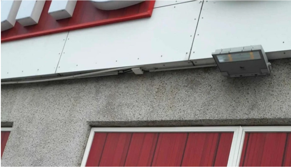
Iceland verslun kynning