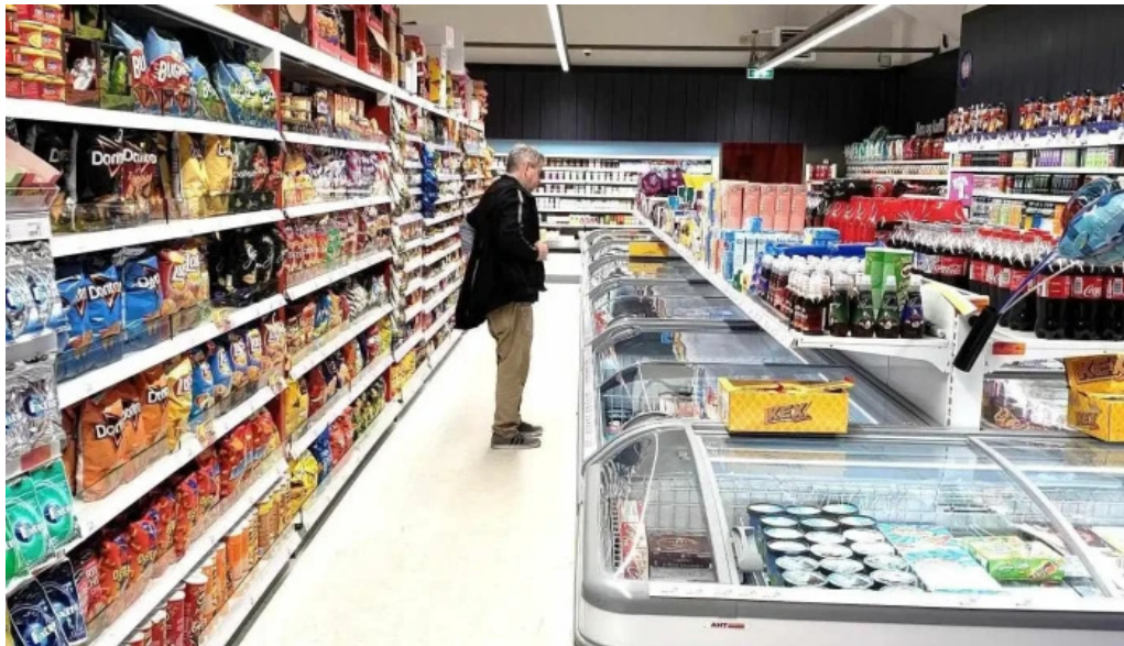
Iceland verslun ad innan