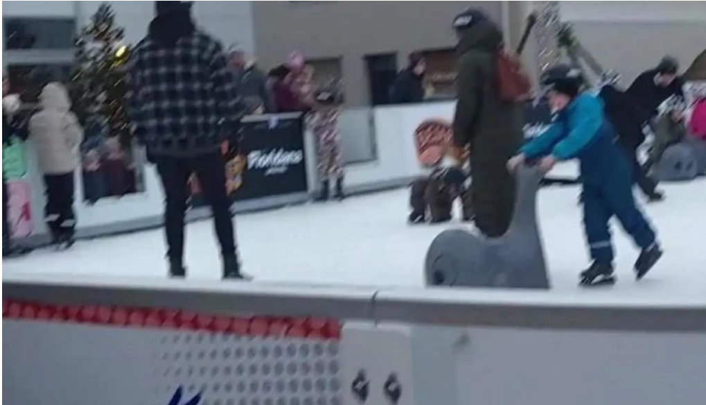
Jolathorpid hafnarfirði ad innan