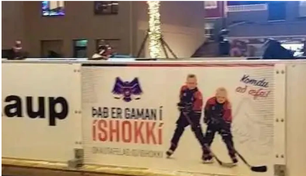
Jolathorpið hafnarfirði hafnarfjorður