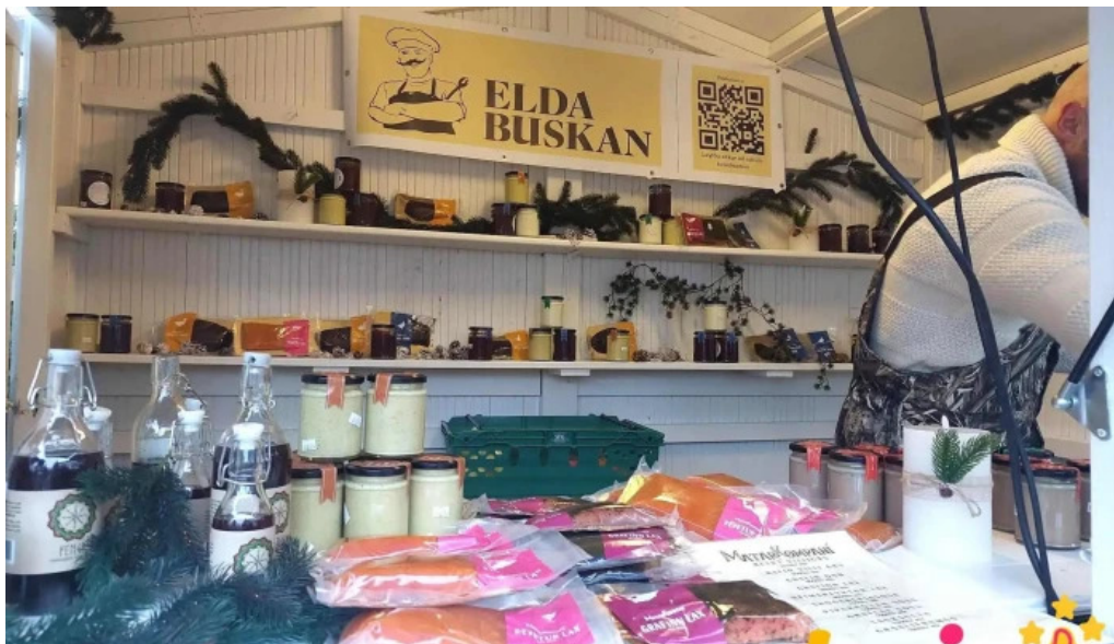
Jolathorpid hafnarfirdi markaður