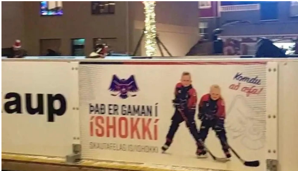
Jolathorpid hafnarfirdi myndskaid