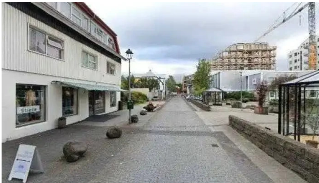
Jolathorpið hafnarfirði street view 360deg