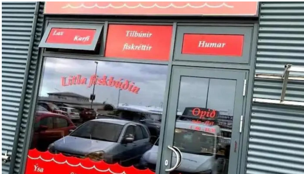
Litla fiskbúðin hafnarfjorður