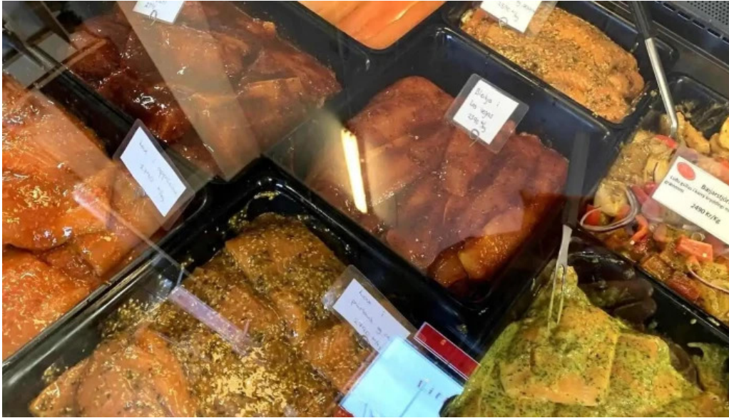
Litla fiskbudin markaður með sjavarfang