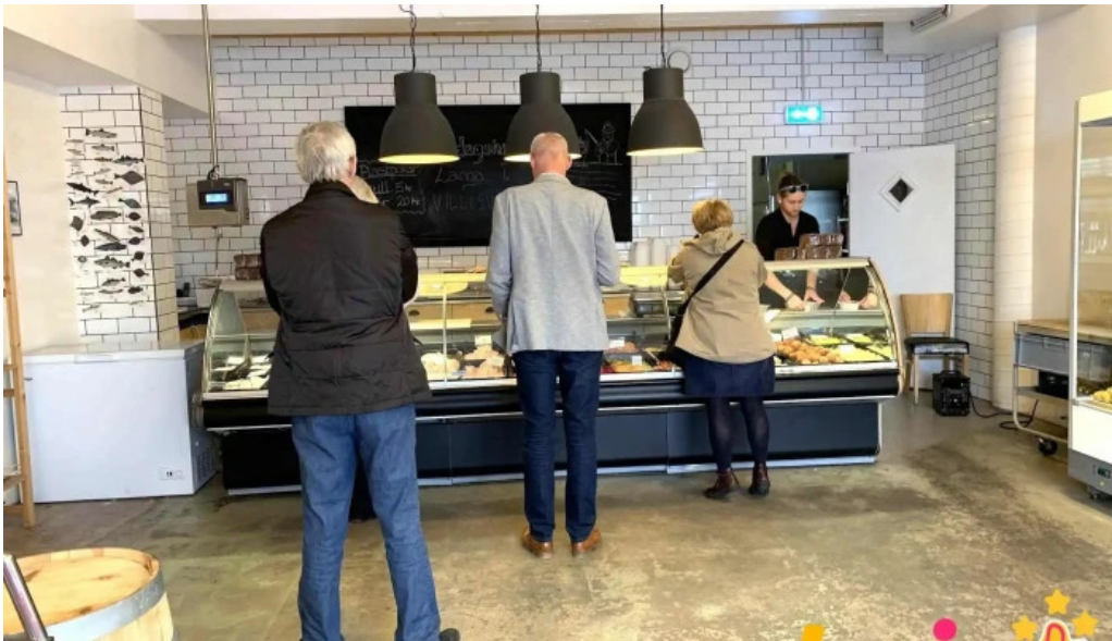
Litla fiskbudin ad innan