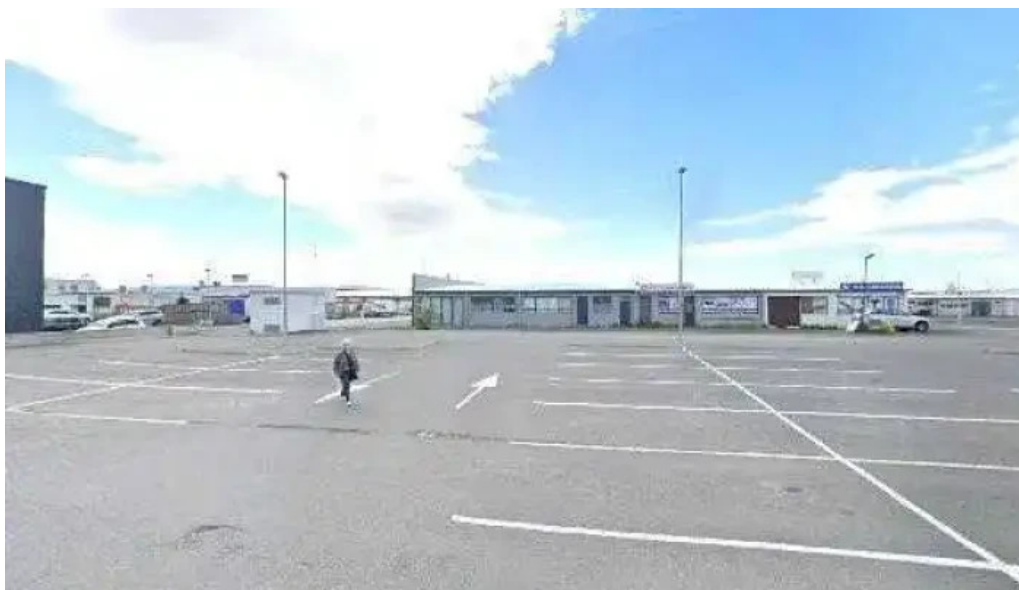
Litla fiskbudin street view 360