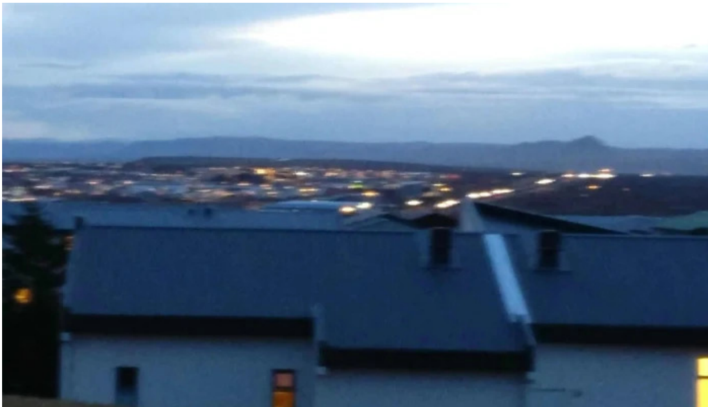
Visit reykjanes iceland afslættir