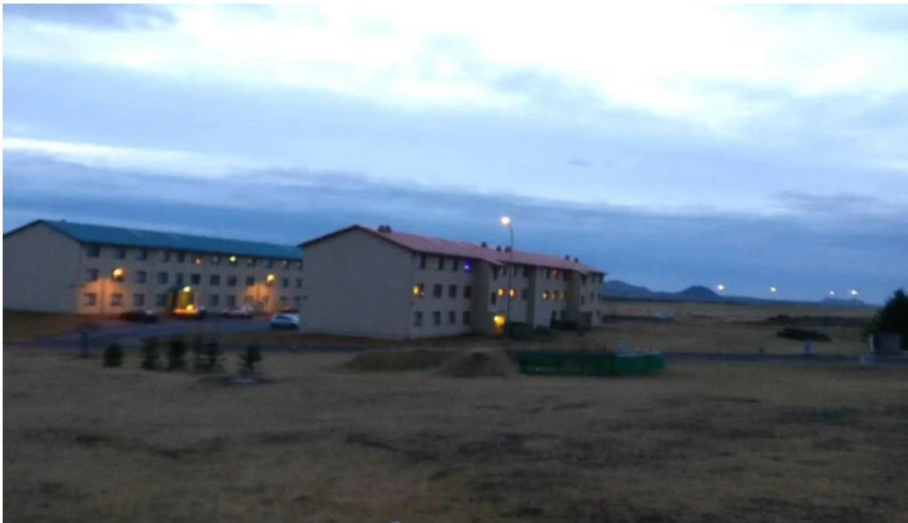
Visit reykjanes iceland keflavik