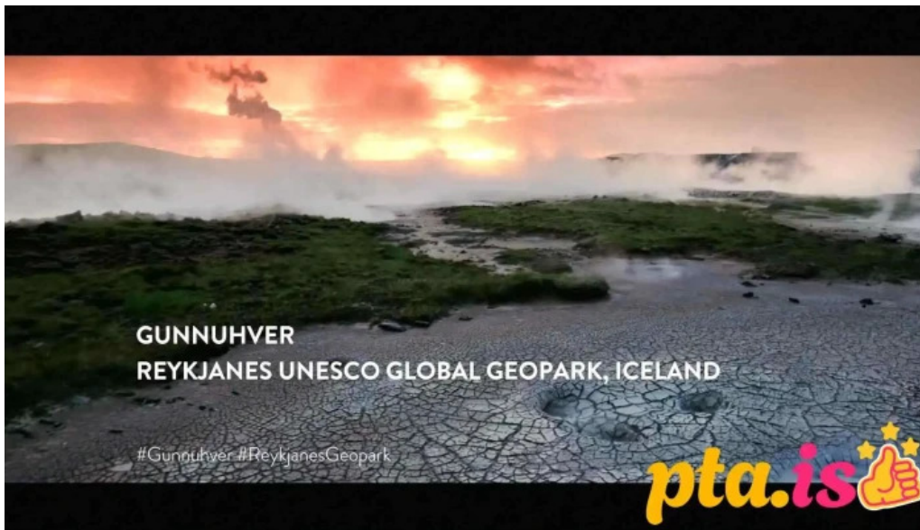
Visit reykjanes iceland markaðsraðgjof