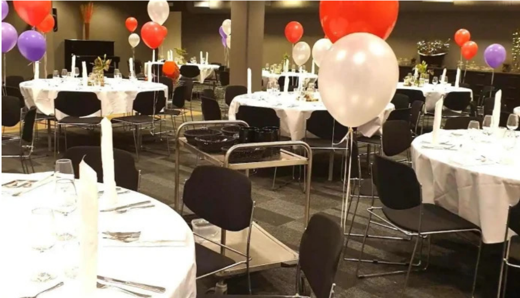
Visit reykjanes iceland ad innan