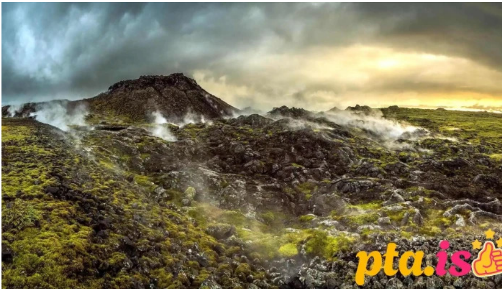
Visit reykjanes iceland fra eiganda