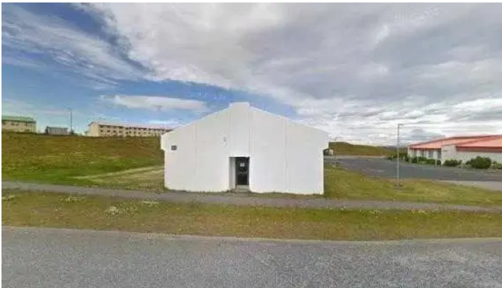
Visit reykjanes iceland street view 360deg