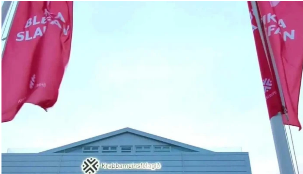
Leitarstod krabbameinsfélags islands myndskeld