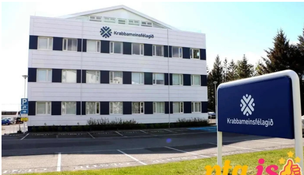
Leitarstod krabbameinsfélags islands læknir