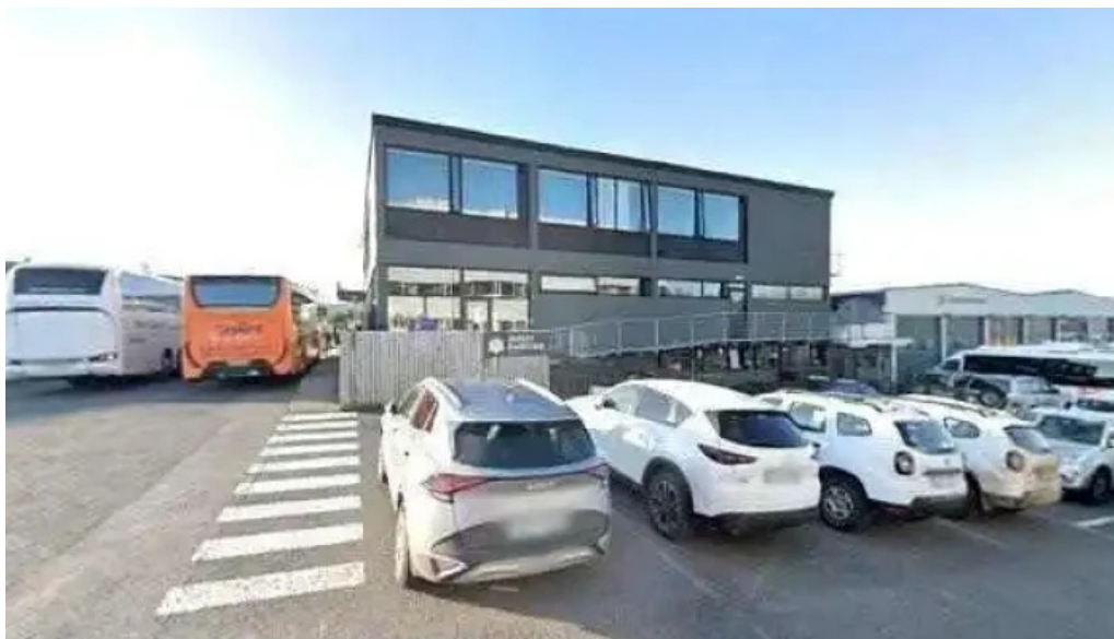
Leitarstöð krabbameinsfélags íslands street view 360deg