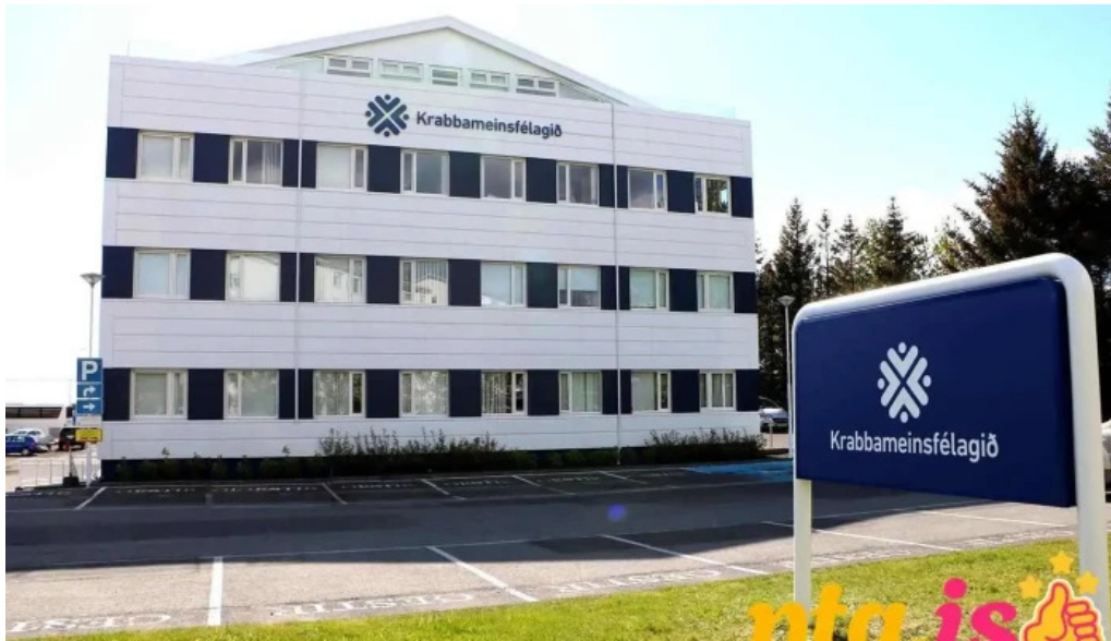
Leitarstöð krabbameinsfélags íslands reykjavík