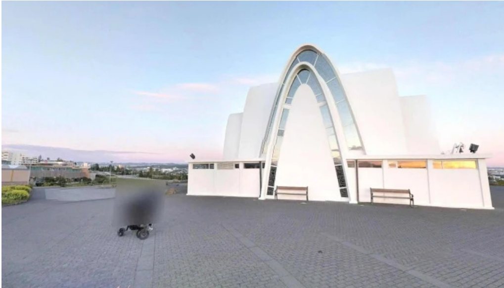
Kopavogskirkja street view 360