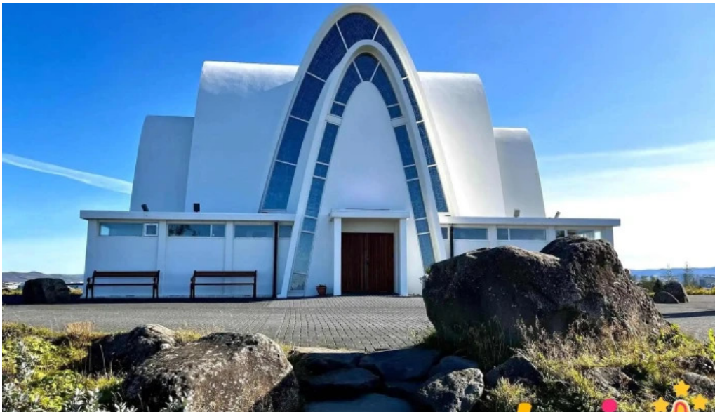
Kopavogskirkja lutersk kirkja