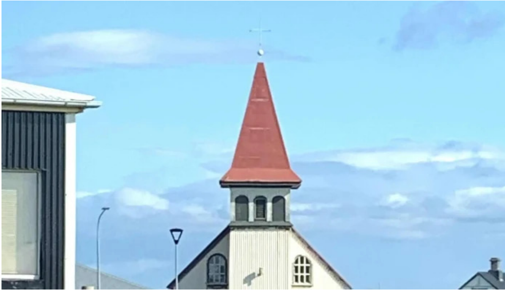
Grindavíkurkirkja eldri verð