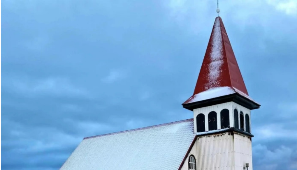
Grindavíkurkirkja eldri umsagnir