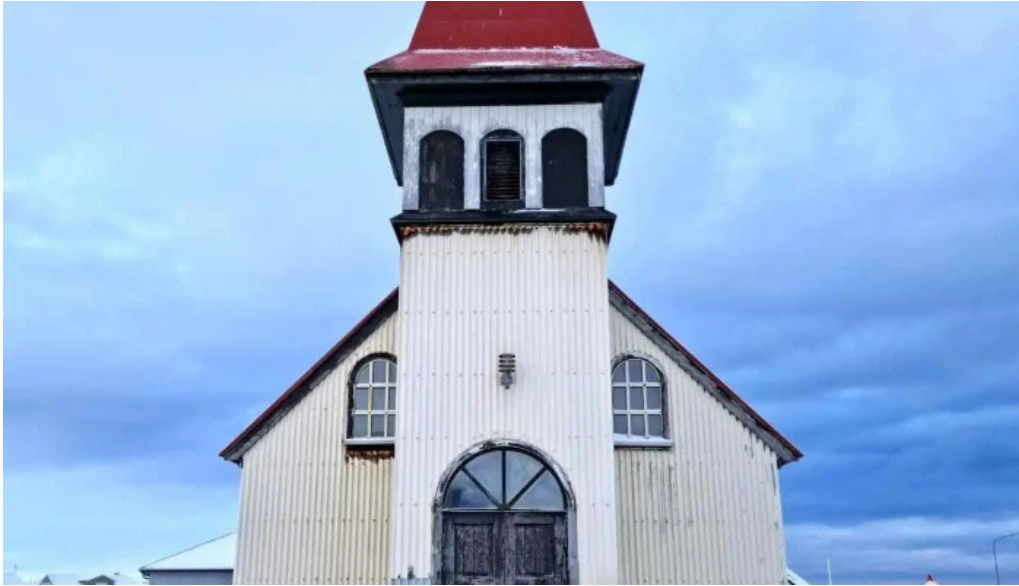
Grindavíkurkirkja eldri lutersk kirkja