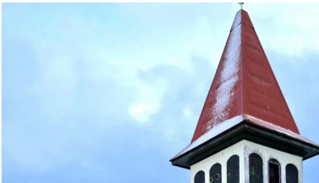
Grindavíkurkirkja eldri grindavík