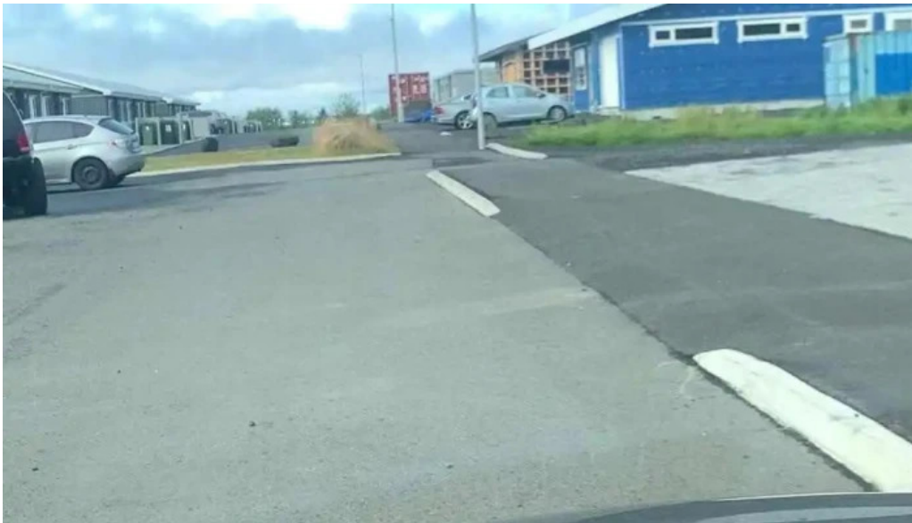
Grindavikurkirkja eldri myndskaid