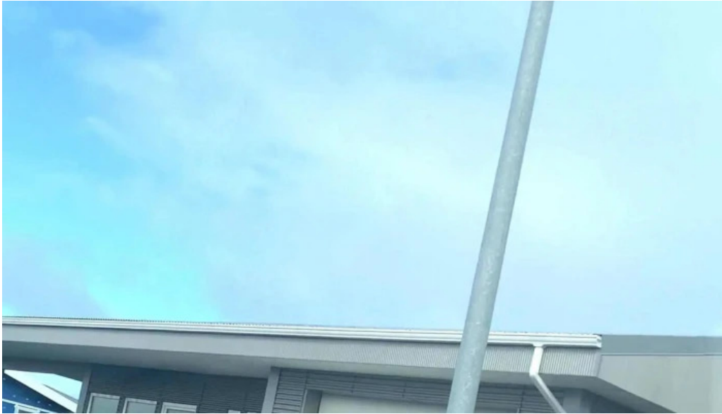
Grindavikurkirkja eldri simi