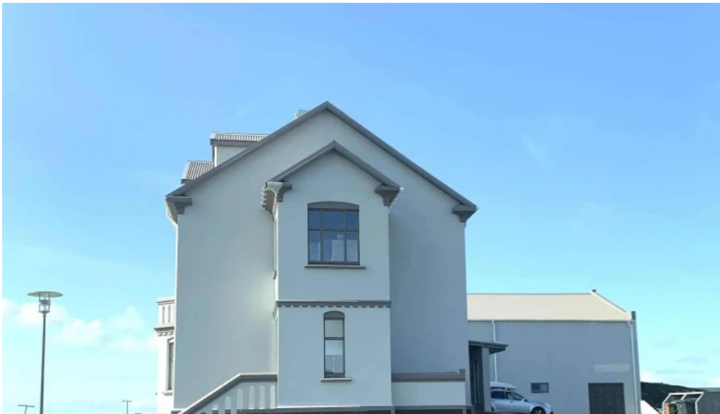
Grindavíkurkirkja eldri vefsiða