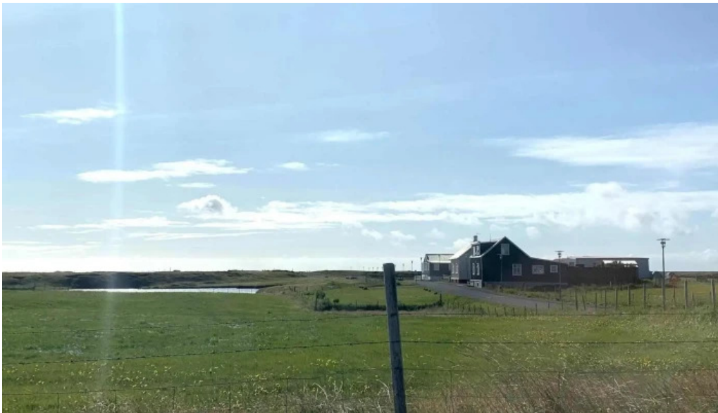
Grindavíkurkirkja eldri heimilisfang