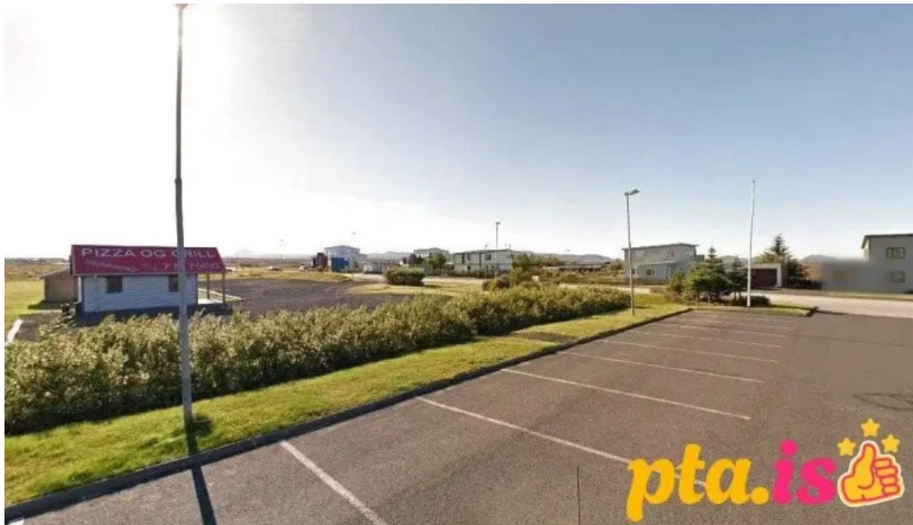
Logreglan a suðurnesjum vogar