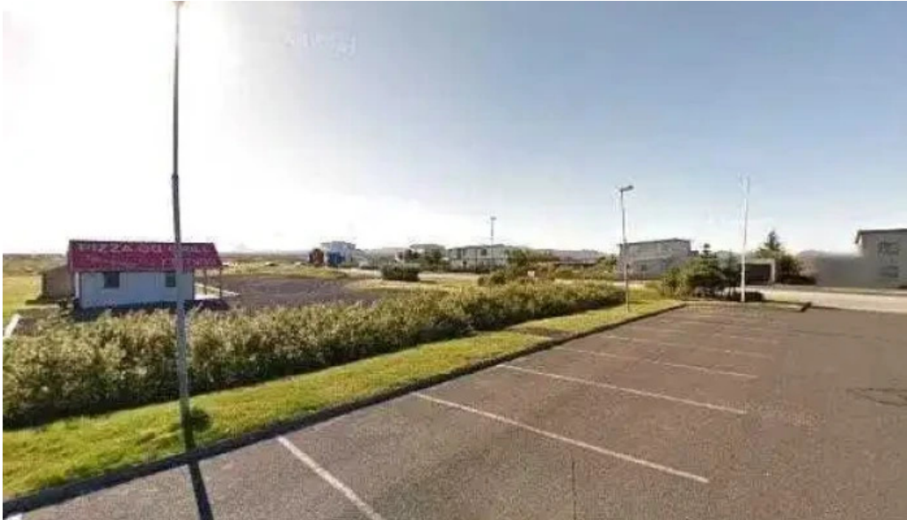
Logreglan a sudurnesjum logreglustoð