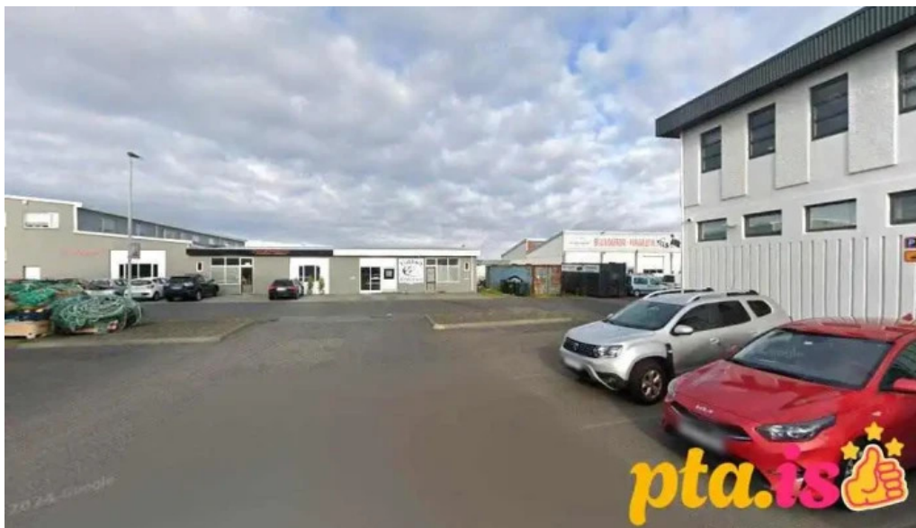
Logreglustjórinn á suðurnesjum njarðvík