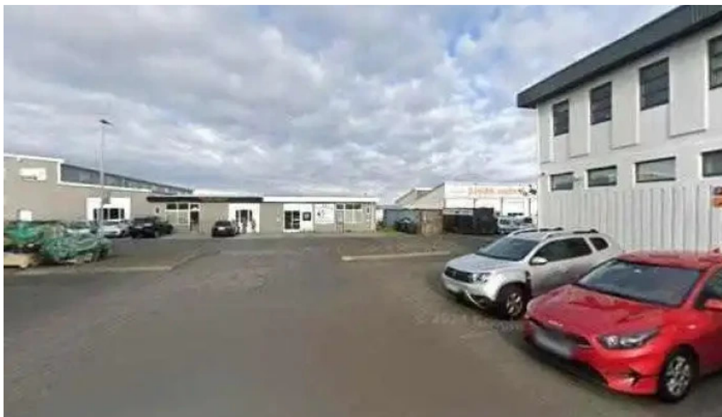
Logreglustjórinn á sudurnesjum logreglustoð