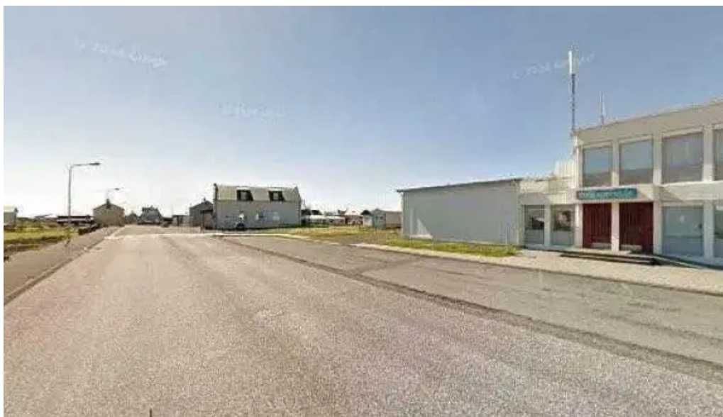
Logreglan á suðurnesjum logreglustoð