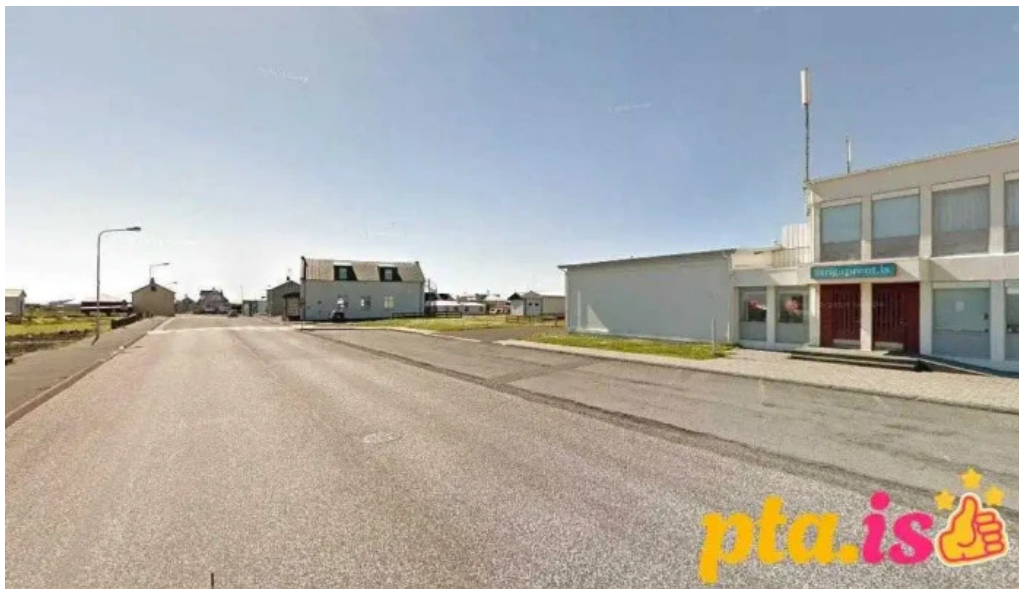
Logreglan á suðurnesjum grindavík