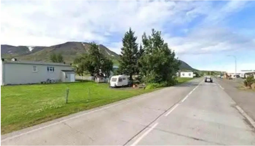
Logreglan a dalvik logreglustoð