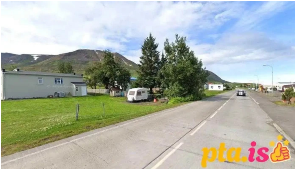
Logreglan a dalvik dalvik