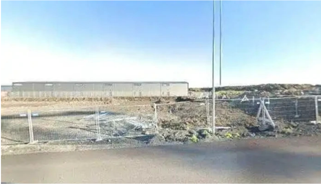
Ingvarthorart street view 360deg