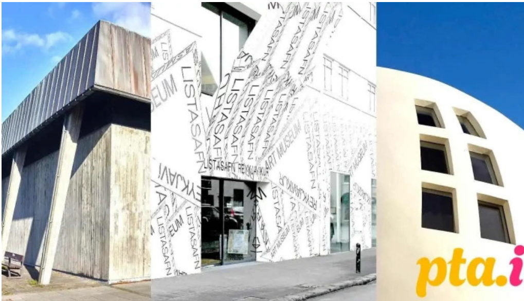
Listasafn reykjavíkur – hafnarhus reykjavík