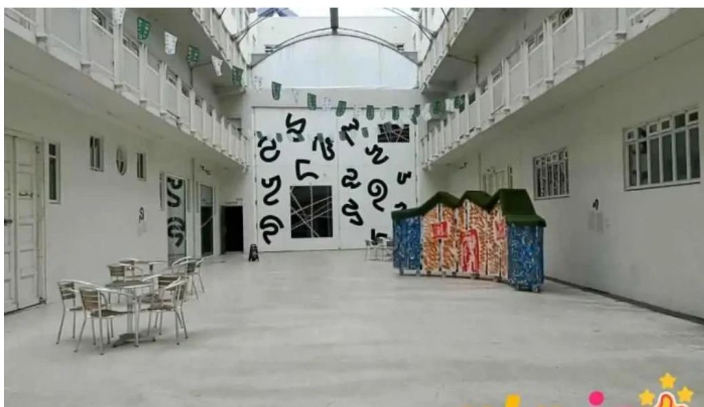
Listasafn reykjavíkur hafnarhus myndskeld