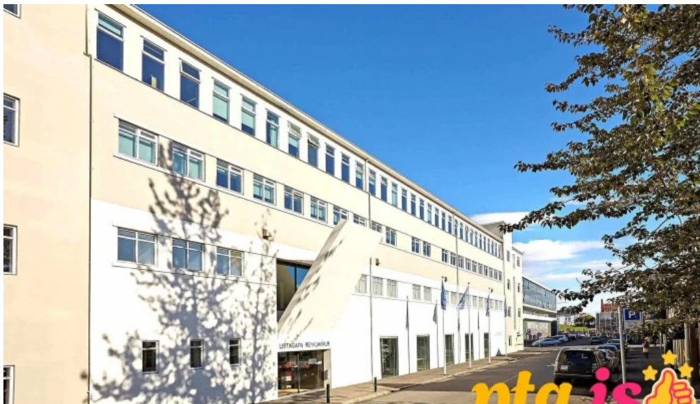
Listasafn reykjavíkur hafnarhus fra eiganda