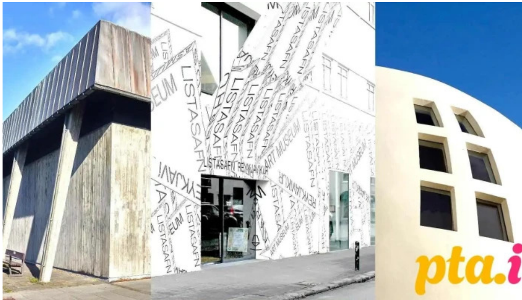
Listasafn reykjavíkur hafnarhus listasafn