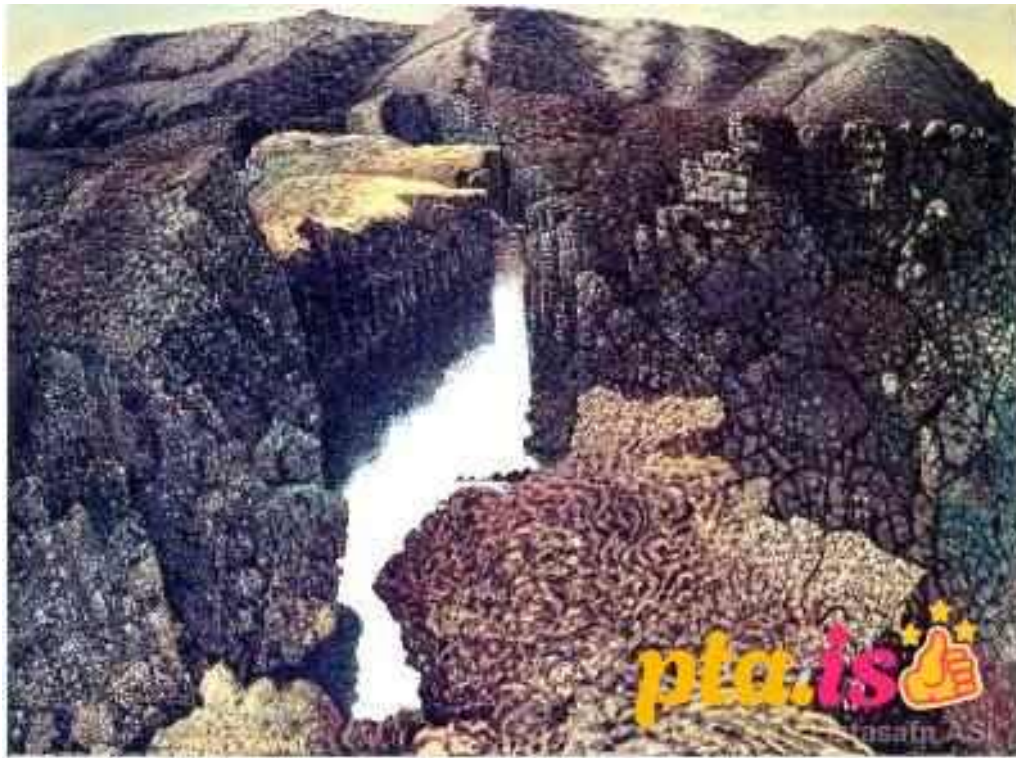
Listasafn asi fra eiganda