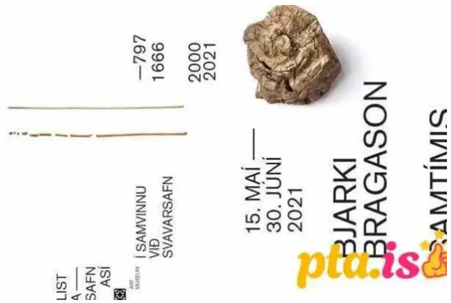
Listasafn asi listasafn