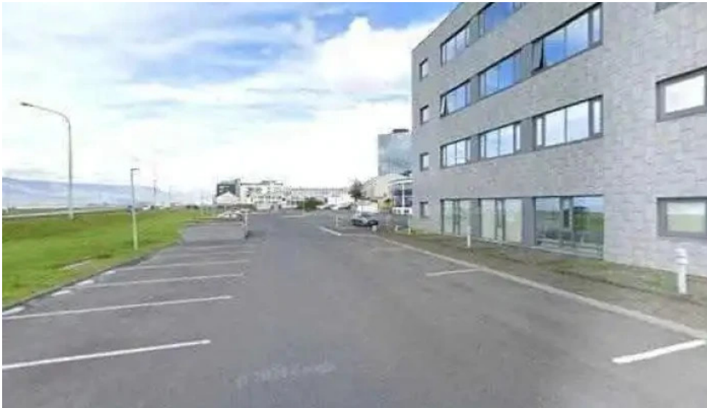
Listasafn asi street view 360deg