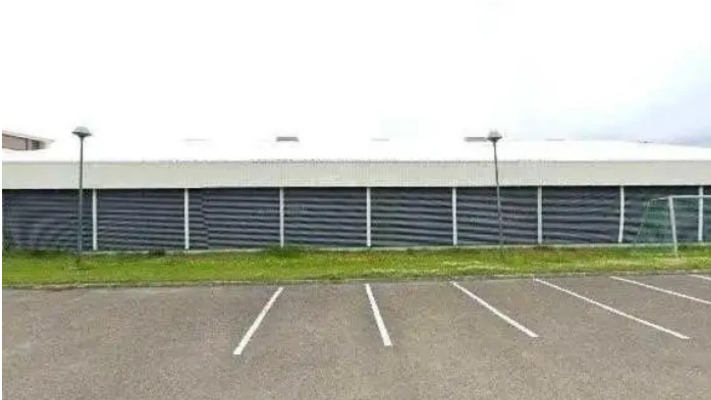
Íþrottahúsið neskaupstað street view 360deg