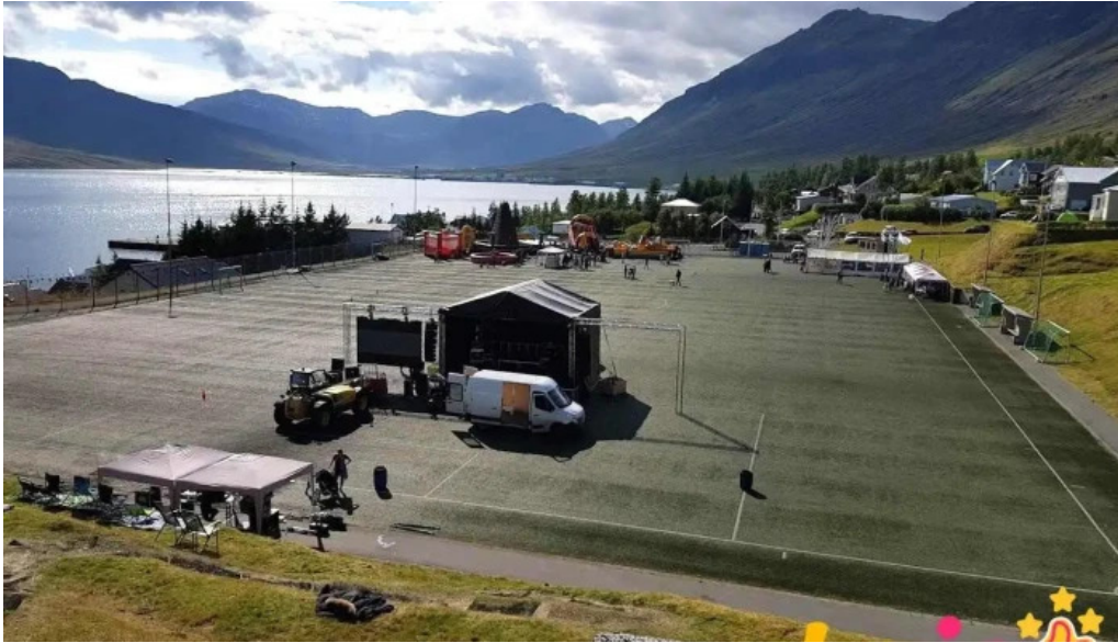
Íþrottahúsið neskaupstað neskaupstaður