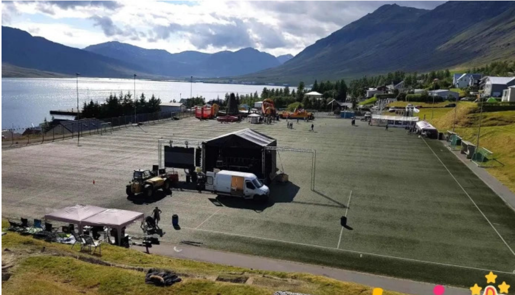
Ithrottahúsið neskaupstad líkamsræktarstoð