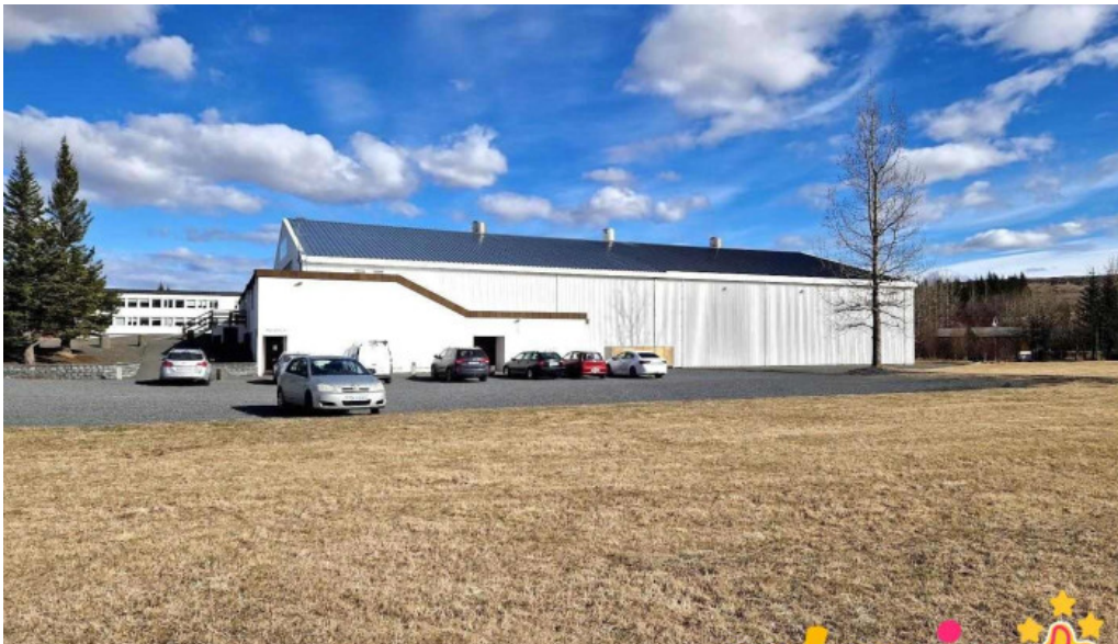
Íþrottahúsið a fluðum fluðir