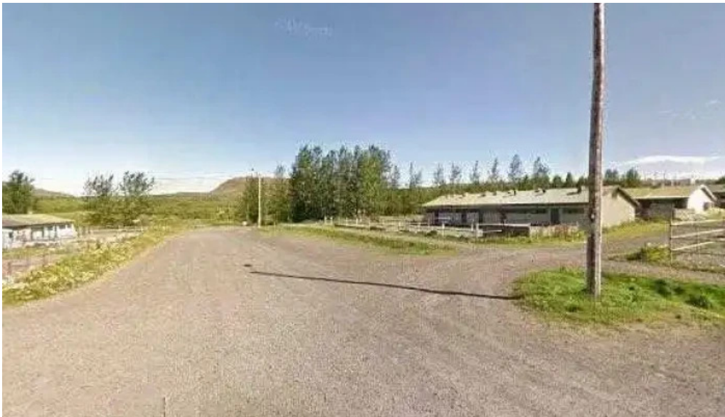
Hesthus mosfellsbæjar leikvangur