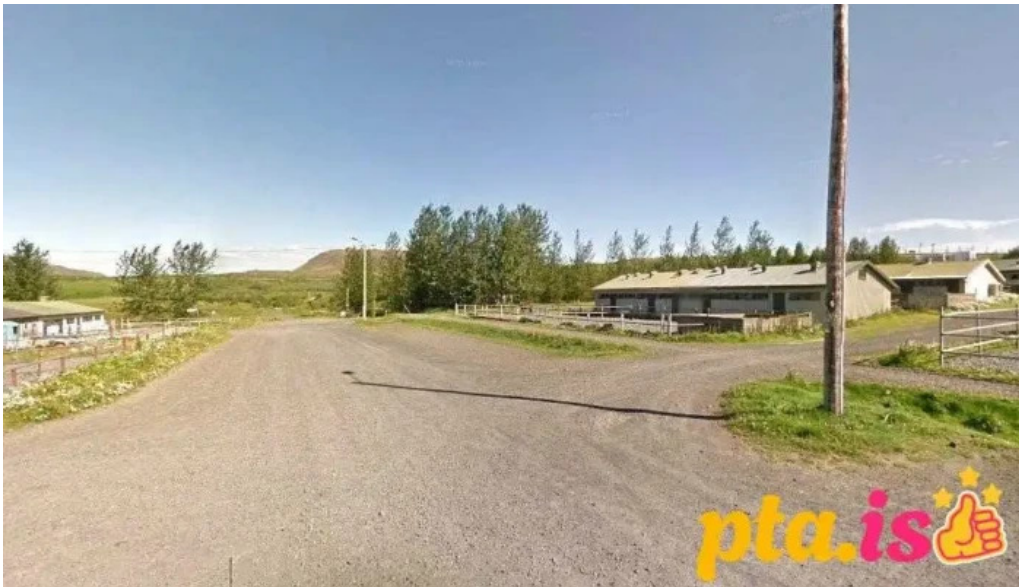
Hesthus mosfellsbæjar mosfellsbær