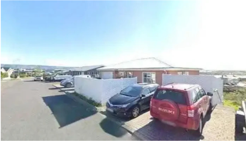
Alfasteinn street view 360deg