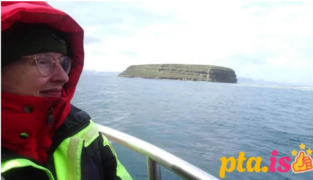
Leikfelag husavikur leikhus