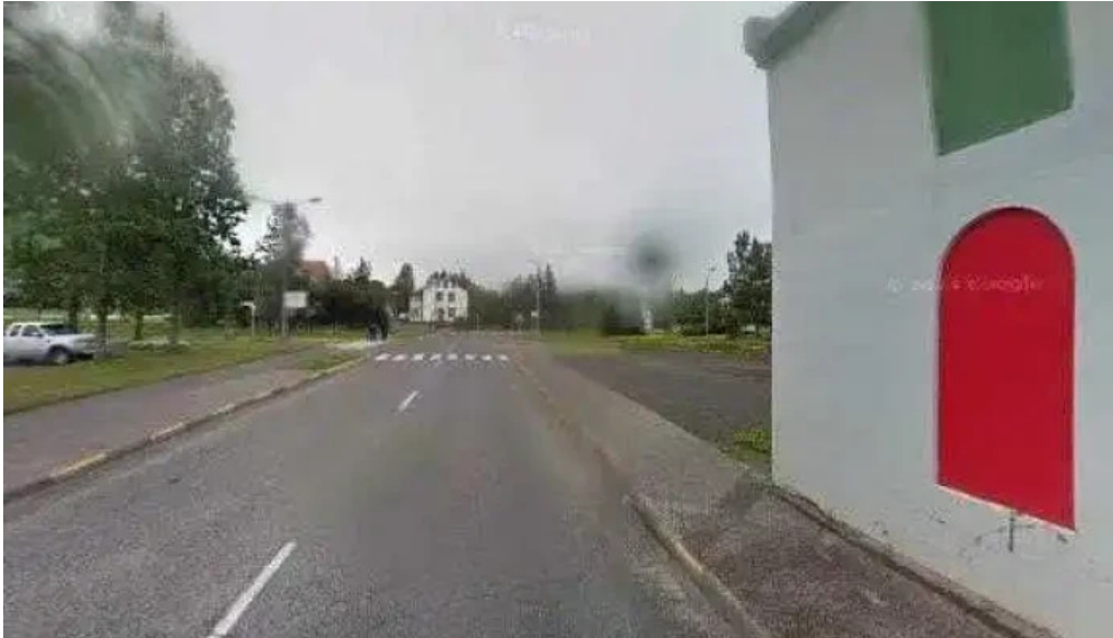
Leikfelag husavikur street view 360deg