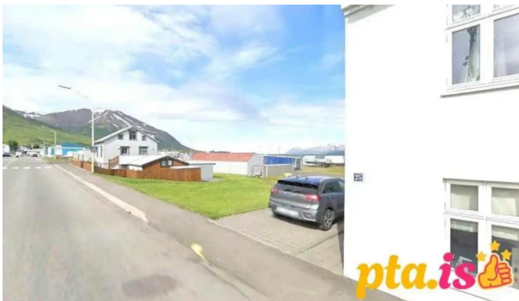
Leikfelag dalvíkur dalvík