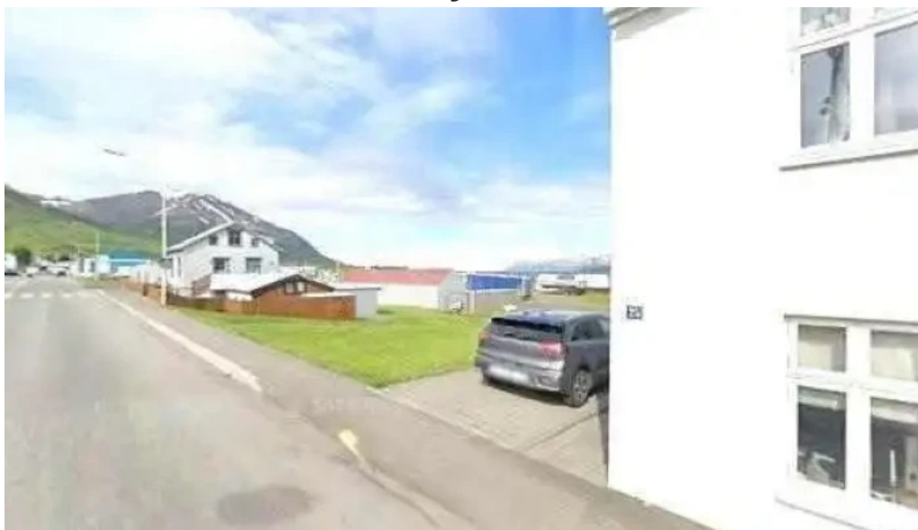
Leikfelag dalvíkur leikhus