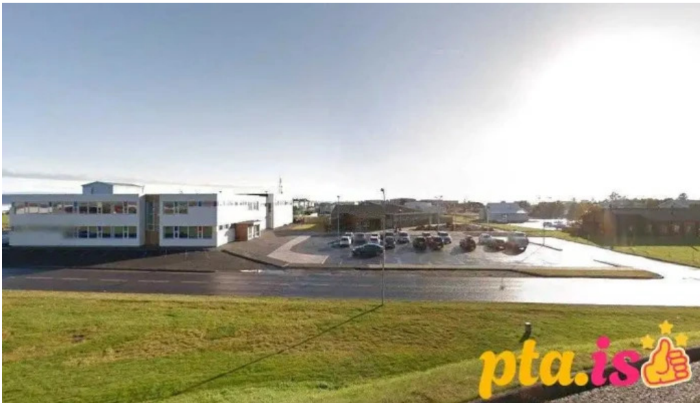
Leikfelag hornafjarðar hofn i hornafirði