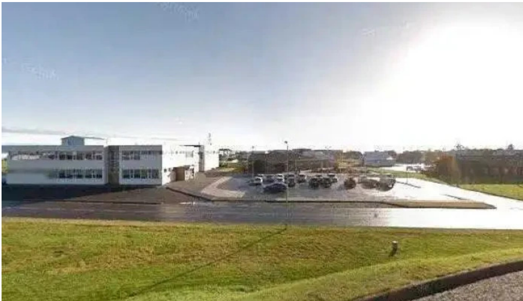
Leikfelag hornafjardar leikfelag