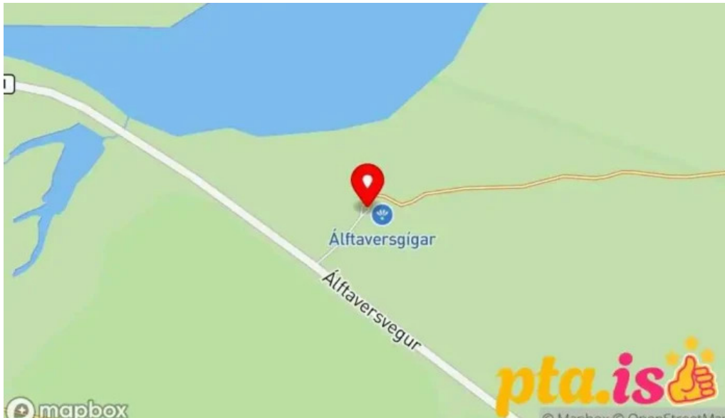
Alftaversgigar view point Kort