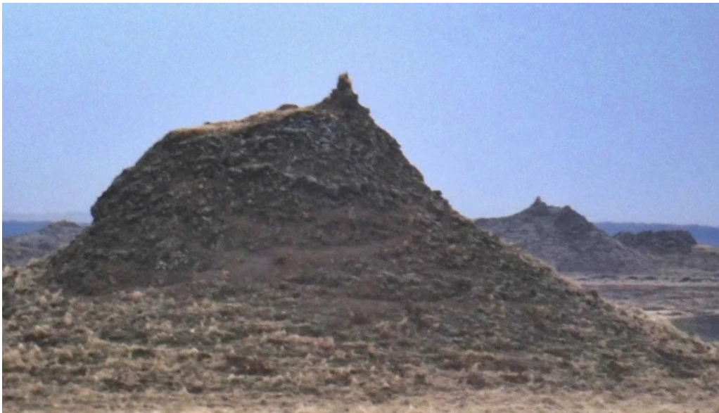
Alftaversgigar view point athugasemdir