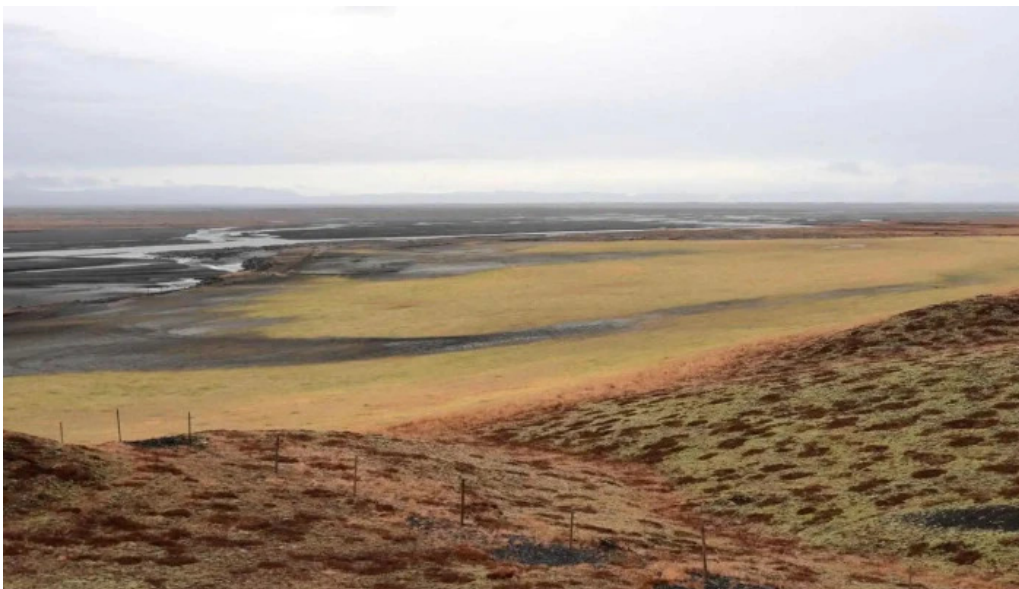
Alftaversgigar view point kynning