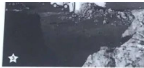
Sæðhús var byggt við Dyrhlaugjökul 1910, fyrsta steinbyggt húsið í spítarni - A hut was built at Dyrhlaugjökul 1910, the first concrete house in Skarftafellssýsla county (1957)