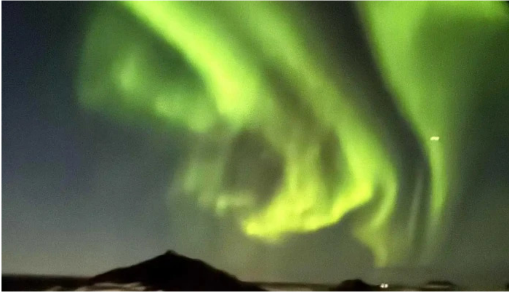
Alftaversgigar view point nyjast