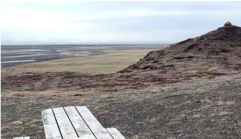
Alftaversgigar view point myndskeld