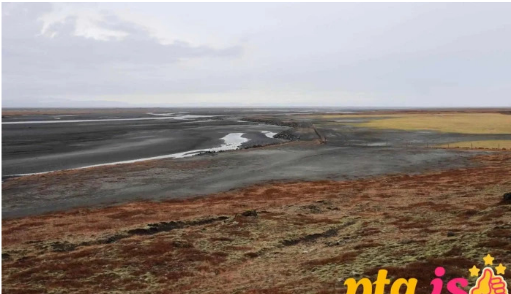
Alftaversgigar view point lautarferðasvæði