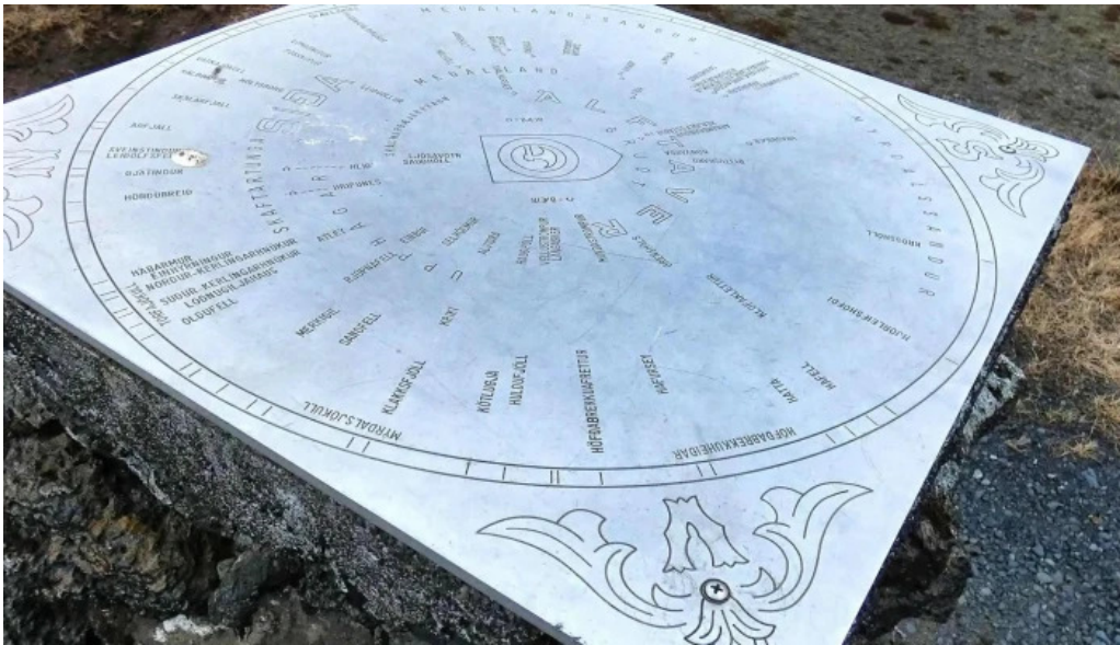
Alftaversgigar view point hvar