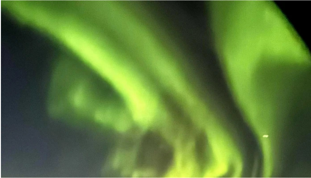
Alftaversgigar view point aætlun