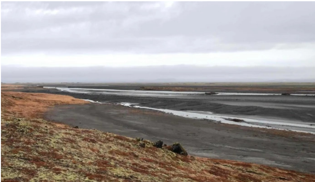
Alftaversgigar view point Þykkvabæjarklaustur