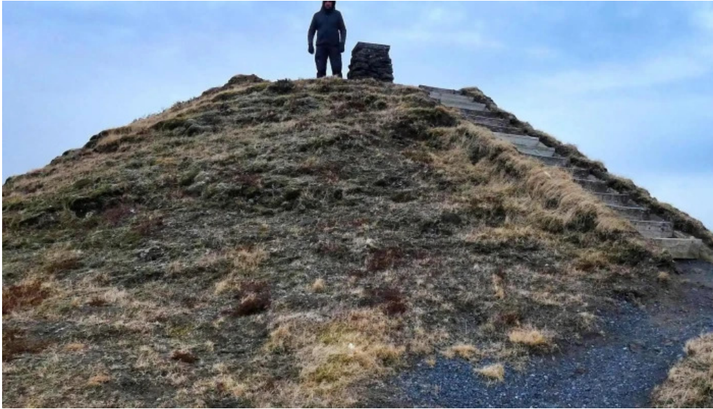
Alftaversgigar view point hvernig a að komast þangað