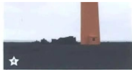
Alftórhafnarvíki, að honum liggur sigalur þorsveigar - Á Alftórhafnarvíki, the lighthouse is accessible with a 4x4 vehicle

centuries that followed there seems to have been a settlement which allowed the settlement to expand again. However, later, the Eldgjá lava, and not least the rootless cones protected the part of the region that is still inhabited. The communities were, however, laid waste by the eruption of 934-940. In 1976, the farm of Kúabót, believed to have been excavated. It was a great milestone in Icelandic history, the dig and the number of relics and valuable