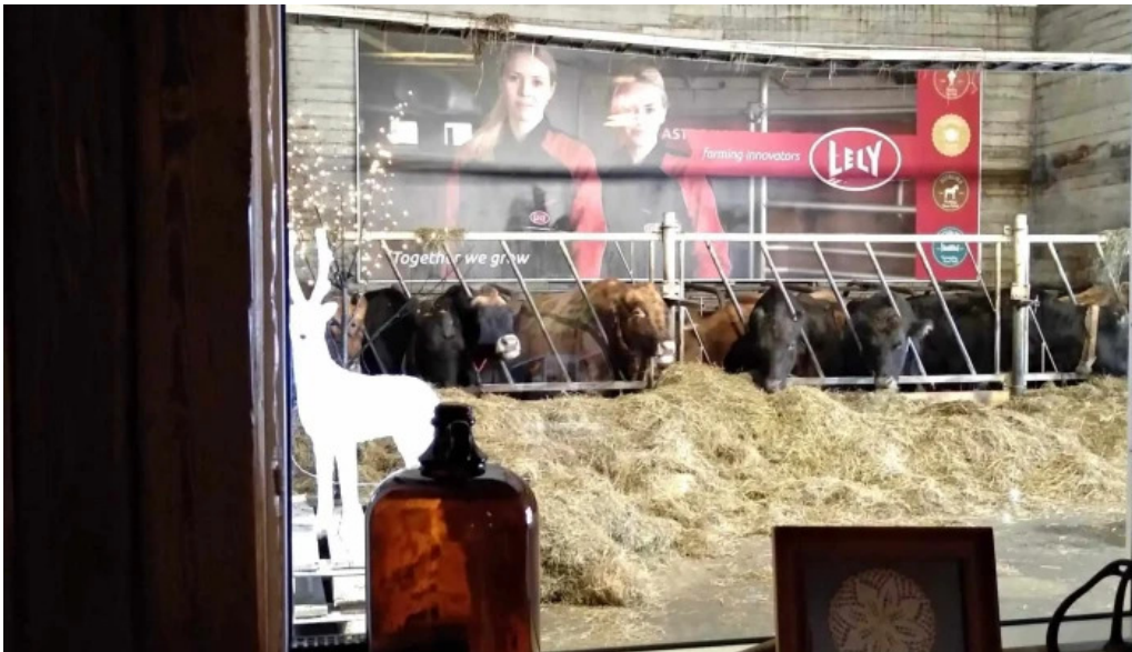
Uthlid the farm myndir