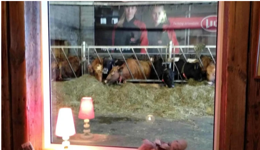
Uthlid the farm hvar