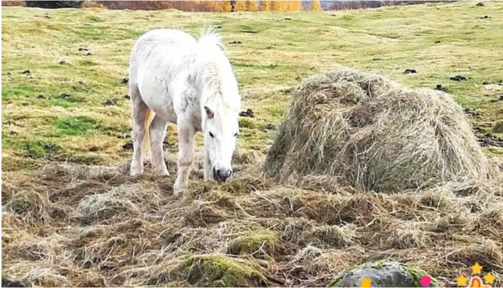
Uthlið the farm 7ggx w2h