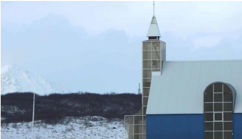
Uthlid the farm svæði