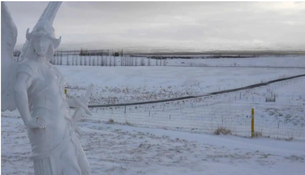
Uthlid the farm ætlun