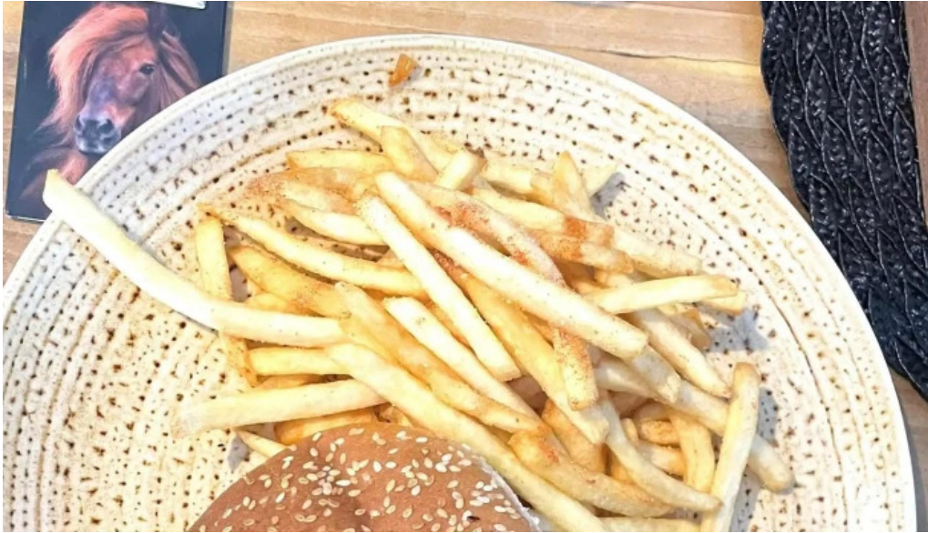
Uthlid the farm afslættir