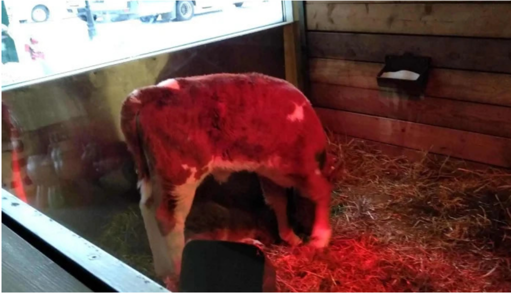
Uthlid the farm einkunn