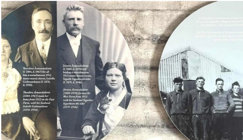
Uthlid the farm hvernig a að komast þangað