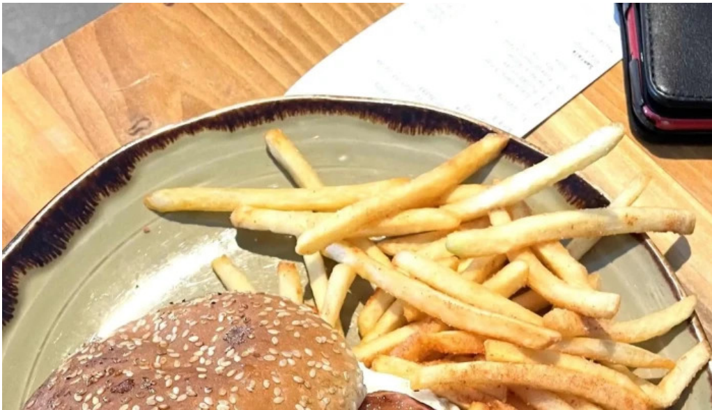
Uthlid the farm verð