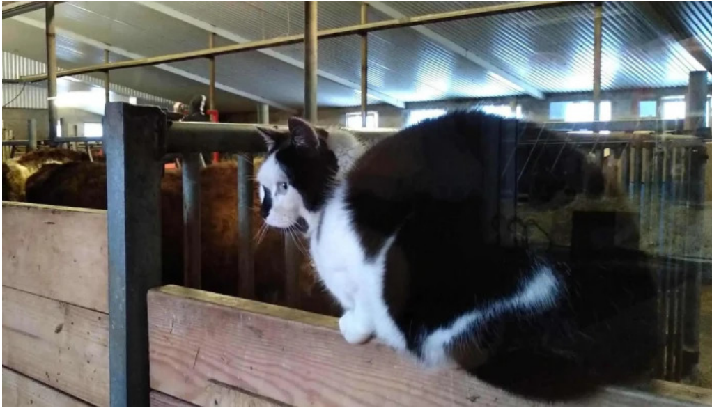
Uthlid the farm vefsiða