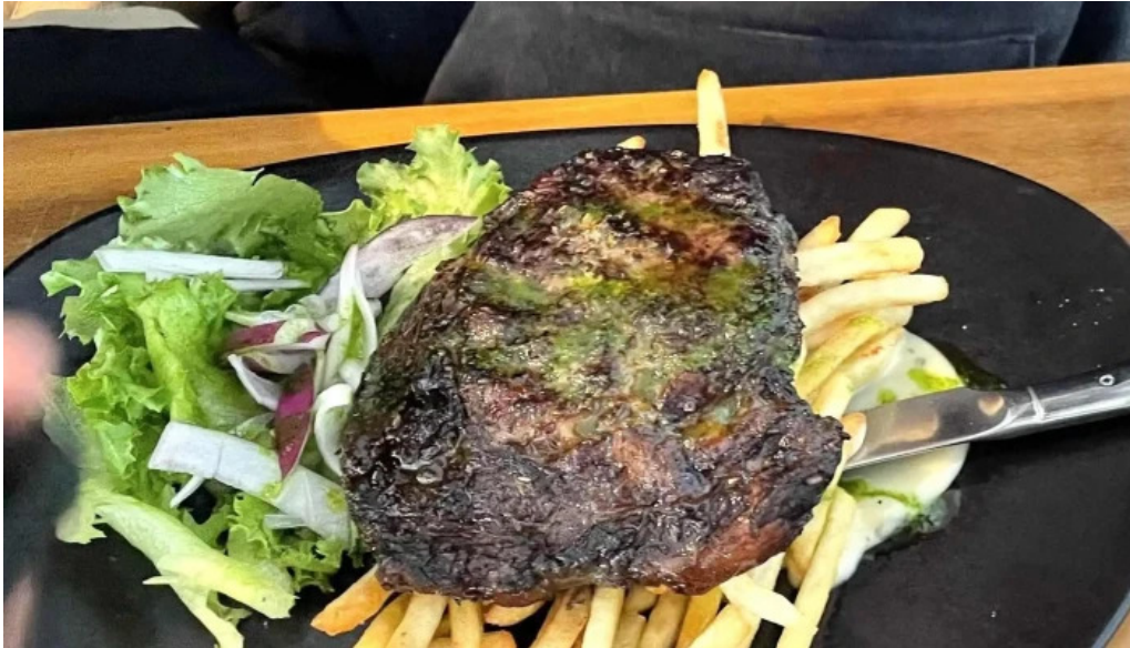
Uthlid the farm 7ggx w2h