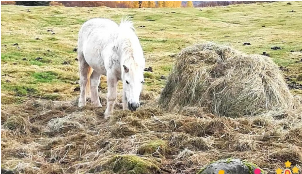
Uthlid the farm landbunaður