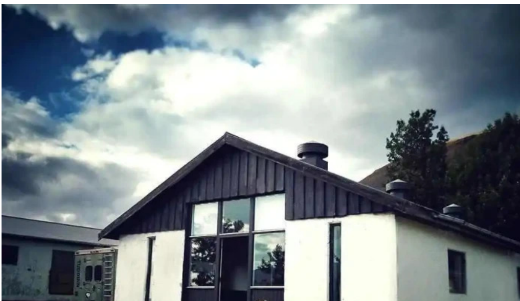
Hals i kjos landbunaðarverslun