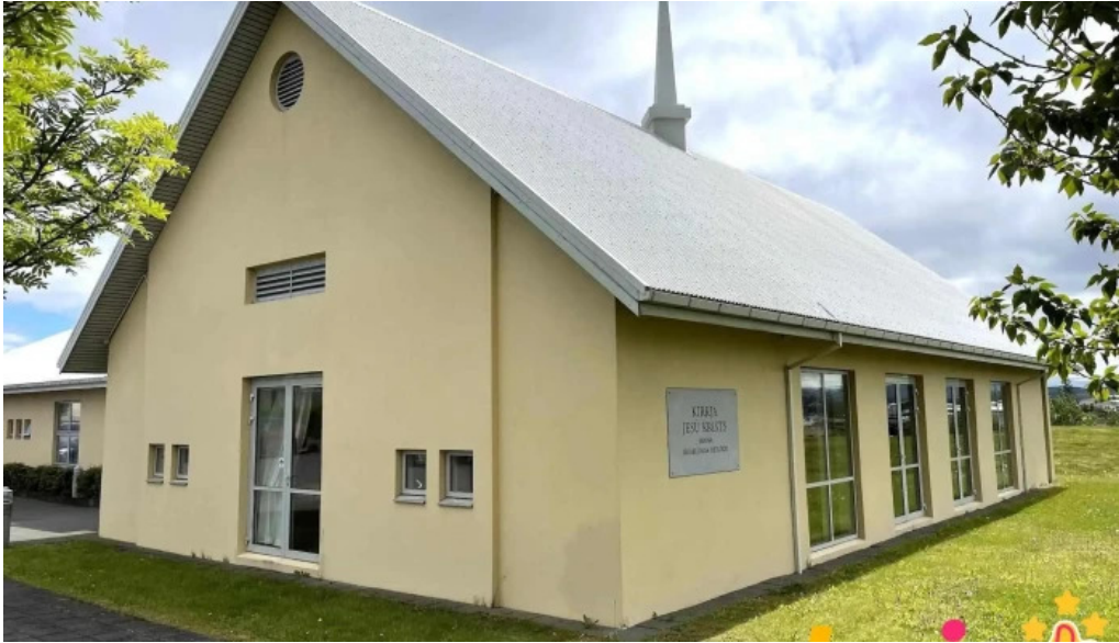
The church of jesus christ of latter day saints kristin kirkja