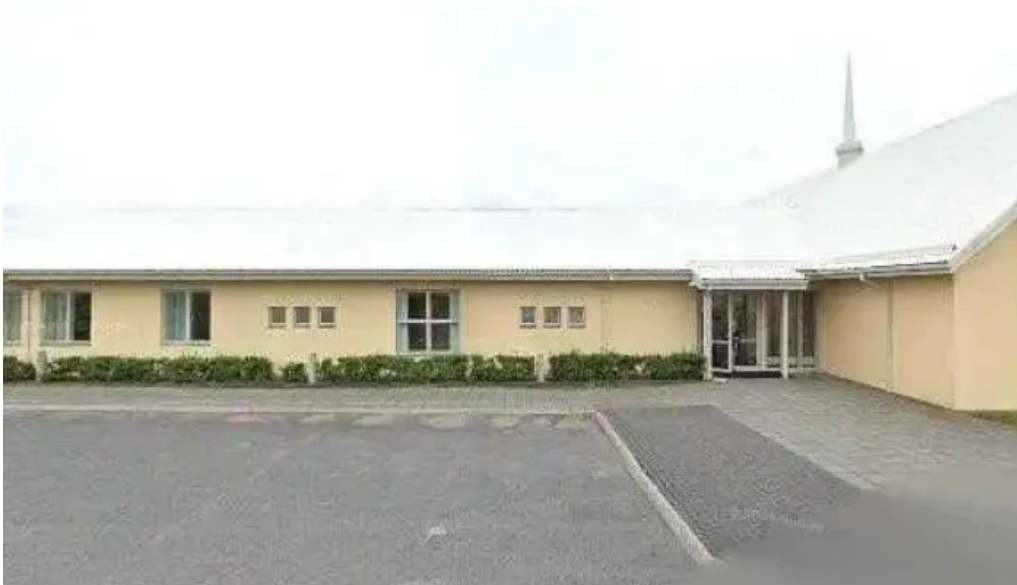
The church of jesus christ of latter day saints street view 360deg