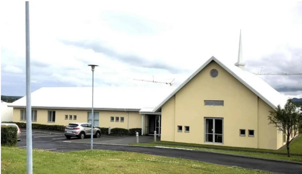
The church of jesus christ of latter day saints hvernig a að komast þangað