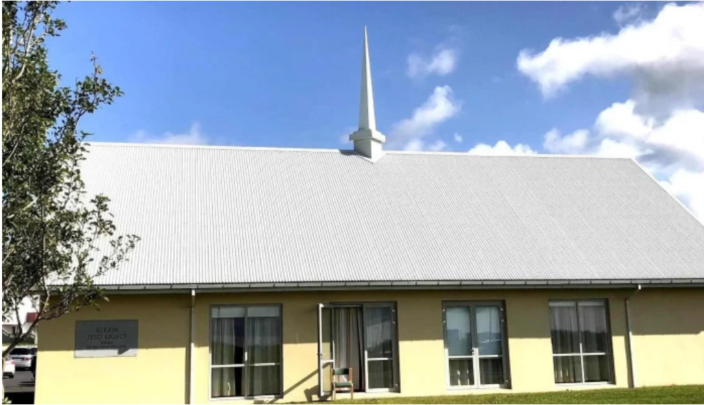
The church of jesus christ of latter day saints simi