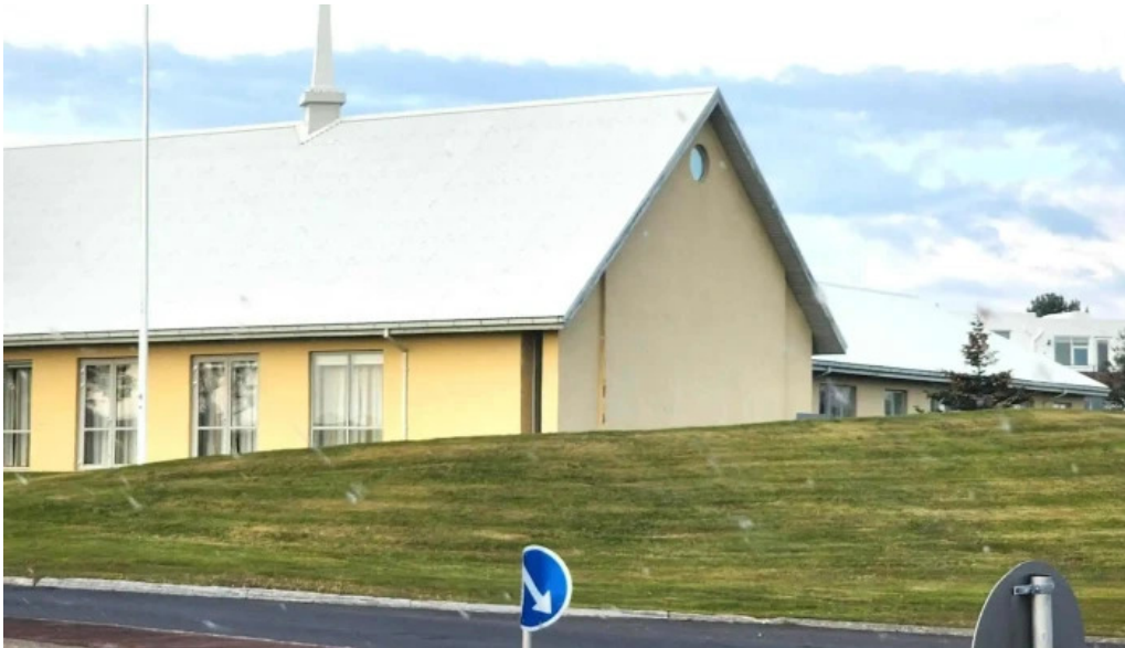
The church of jesus christ of latter day saints garðabær