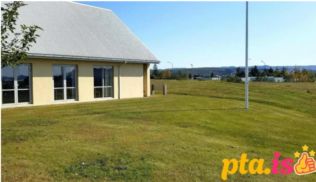
The church of jesus christ of latter day saints myndskleid