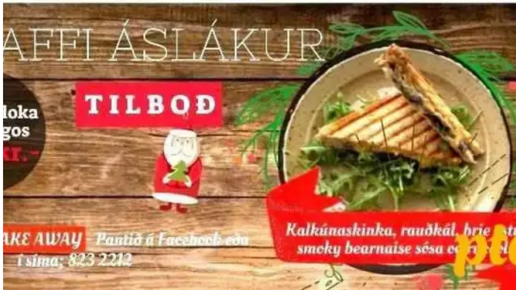
Aslakur fra eiganda