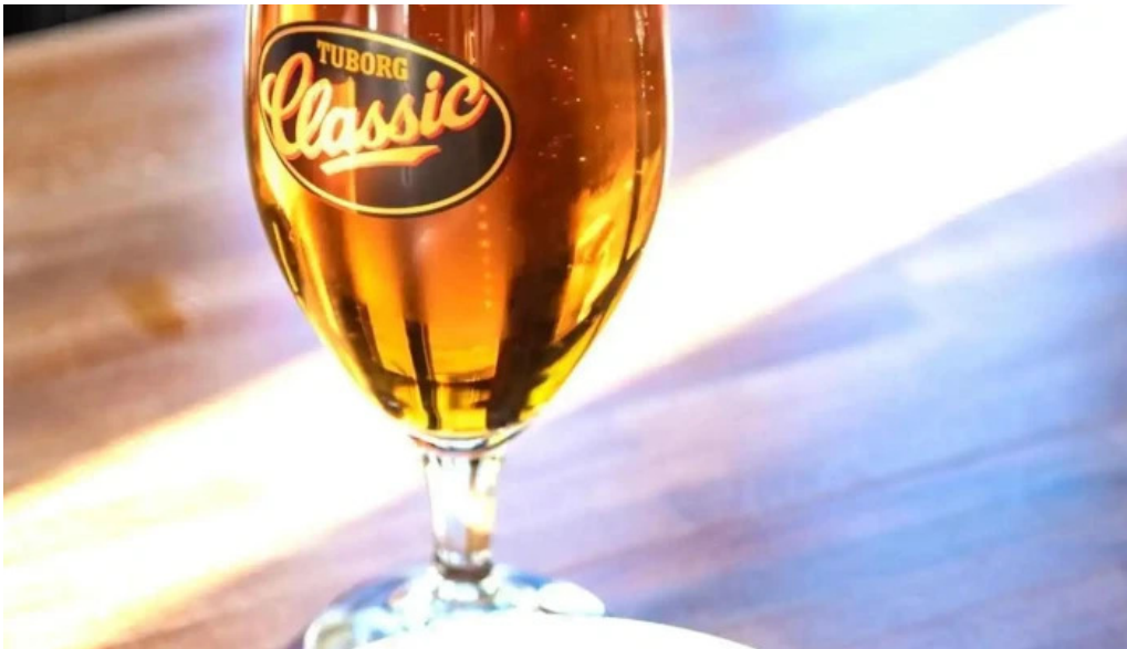
Aslakur matur og drykkur