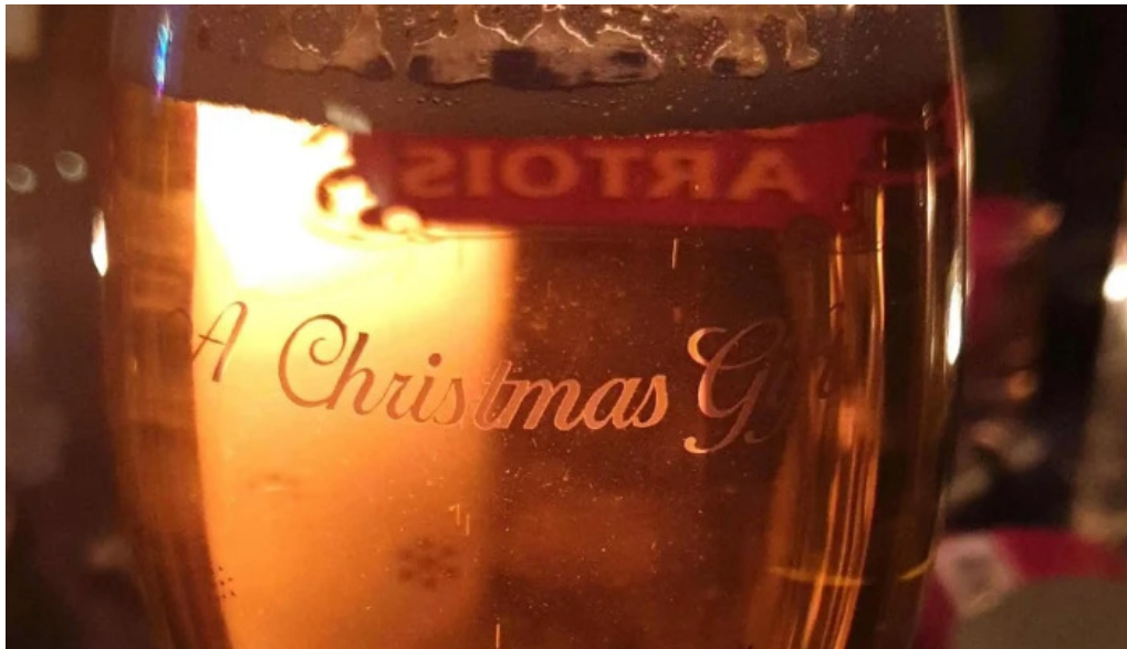
Litla brugghusid ætlun