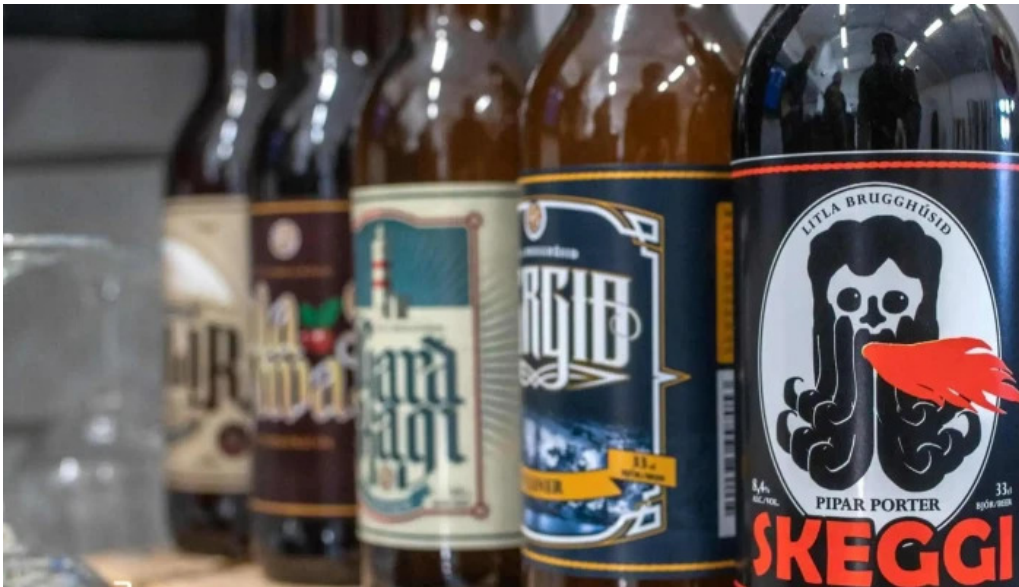
Litla brugghusid kynning