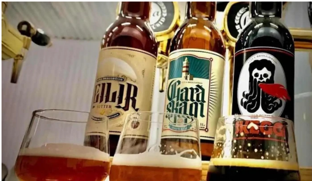
Litla brugghúsið garður