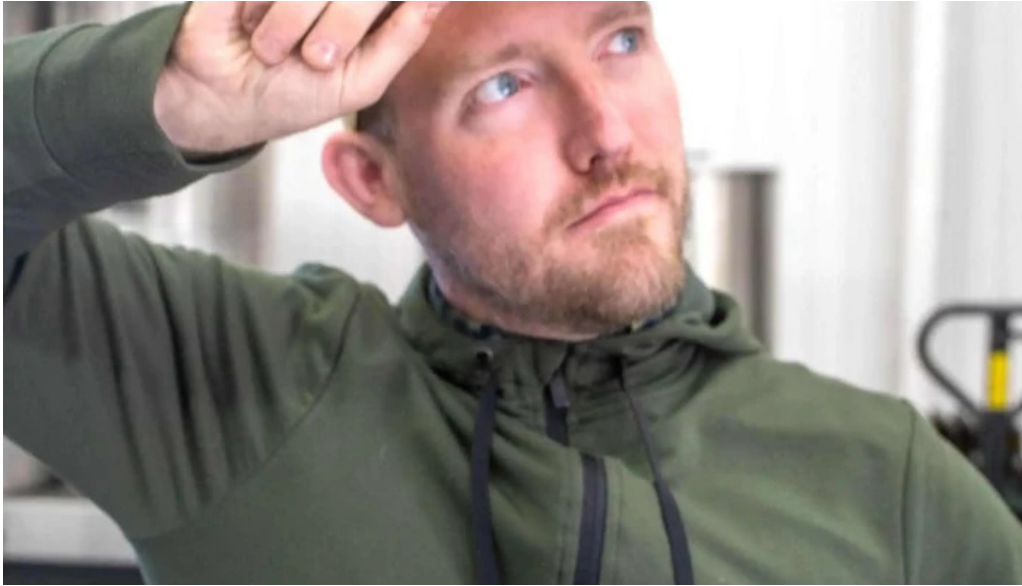
Litla brugghusid instagram