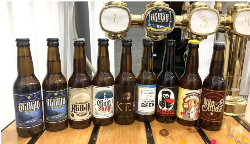
Litla brugghusid bjor