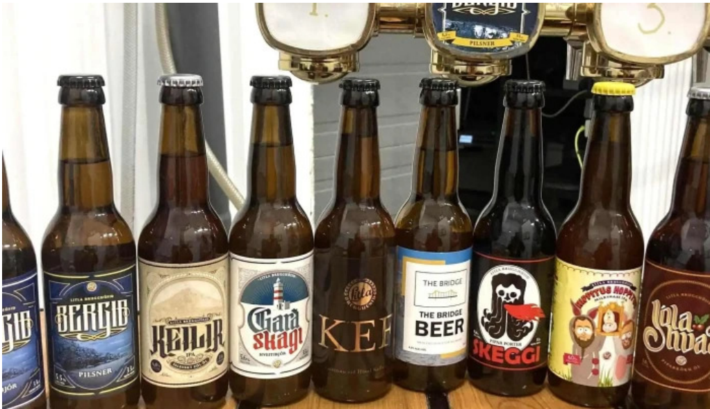
Litla brugghusid garður