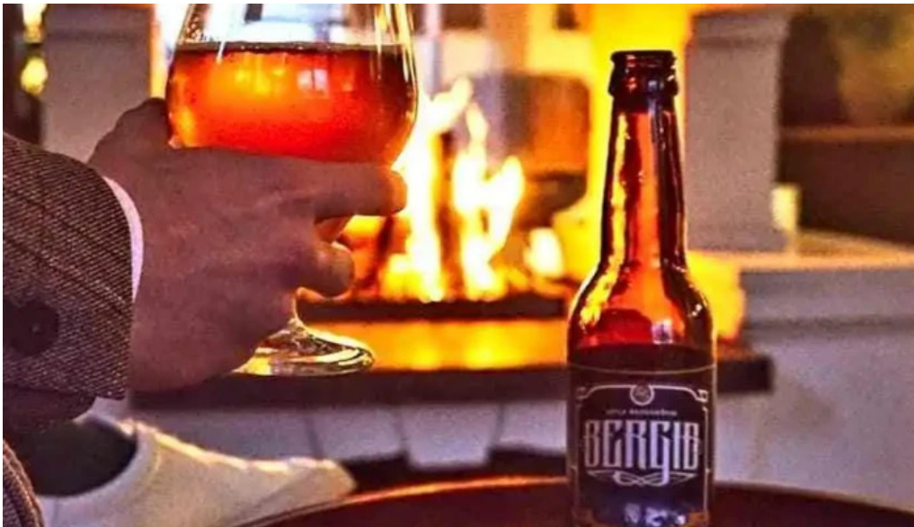
Litla brugghusid matur og drykkur