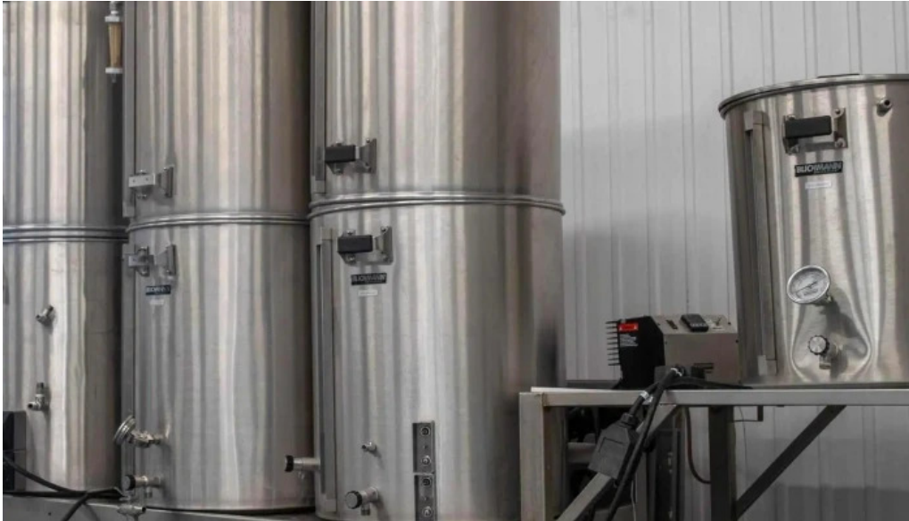
Litla brugghusid numer