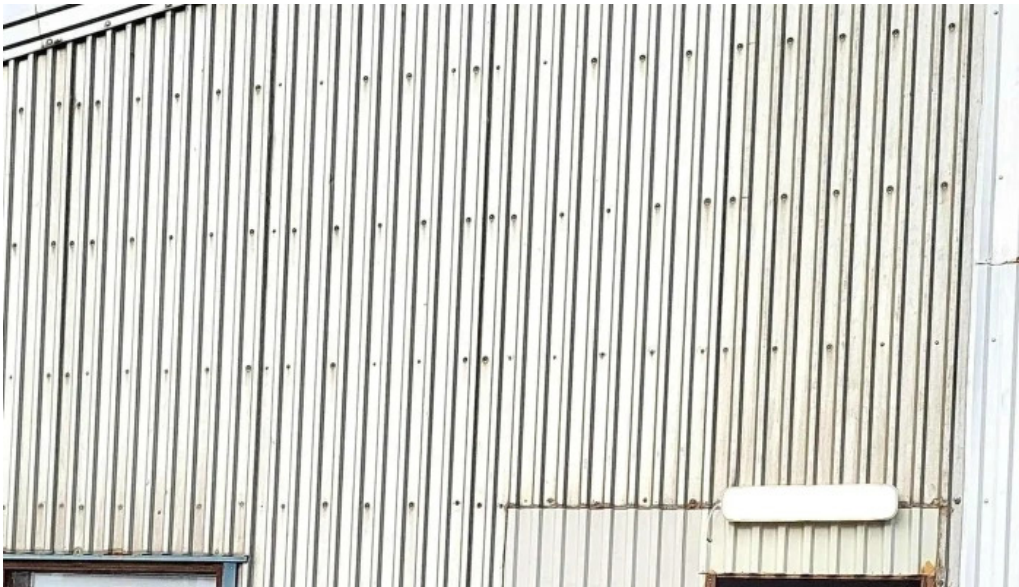
Litla brugghusid staðsetning