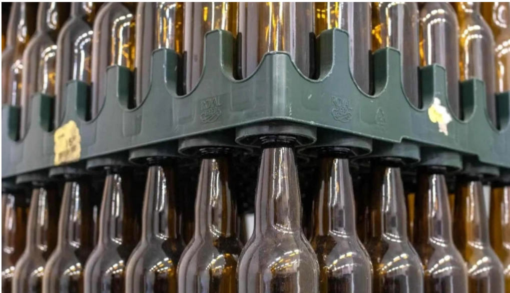
Litla brugghusid nalægt mer