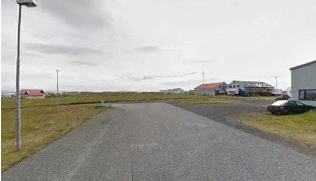
Litla brugghusid street view 360deg