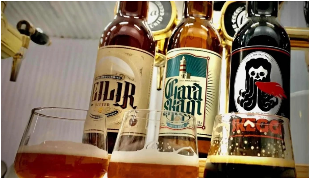
Litla brugghusid kra með eigin bjorframléiðslu