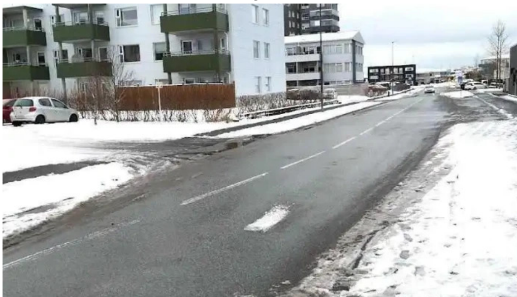
Kirkjugarður hafnarfjarðar hafnarfjorður